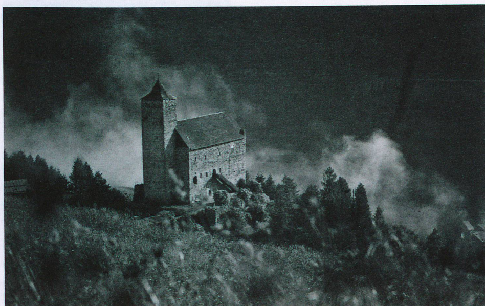
Photo Burg Rion, Graubünden. Origen Festival Cultural