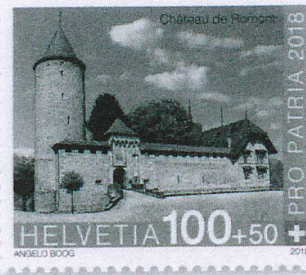
Sonderbriefmarke Schloss Romont CHF 1.00 + 0.50

Ab 17. Mai 2018 beschränkt gültig. Der Taxzuschlag von 50 Rappen kommt Pro Patria zugute.