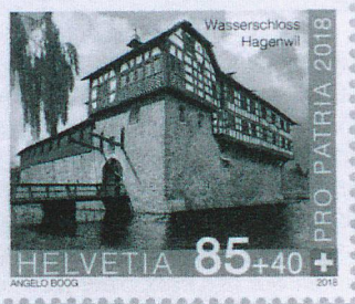
Sonderbriefmarke Wasserschloss Hagenwil CHF 0.85 + 0.40

Die Serie "Burgen und Schlösser der Schweiz" startete 2016 mit der Burg Zug und dem Schloss Neu-Bechburg. 2017 wurde sie mit dem Castello Visconteo und dem Schloss Oberhofen fortgesetzt. 2018 erscheinen nun die beiden letzten Sujets dieser Reihe: das Wasserschloss Hagenwil und das Schloss Romont