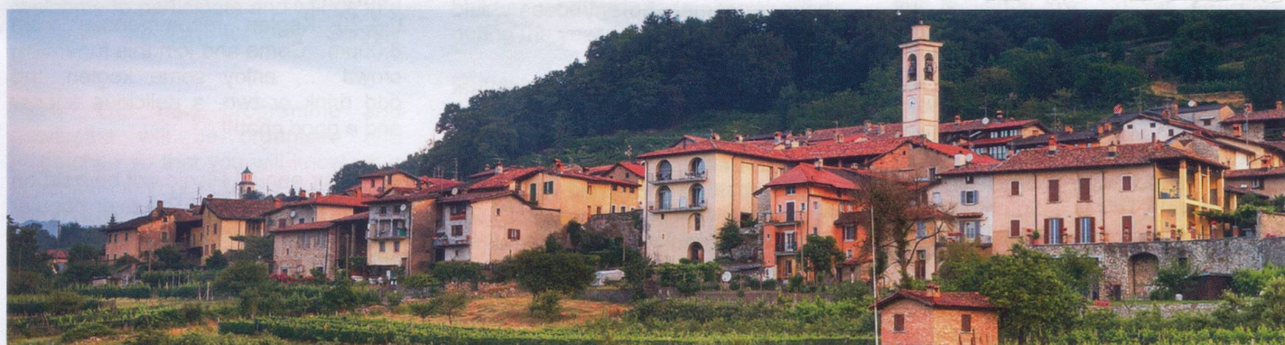
Picturesque Meride on Monte San Giorgio, a Swiss Heritage site of national importance