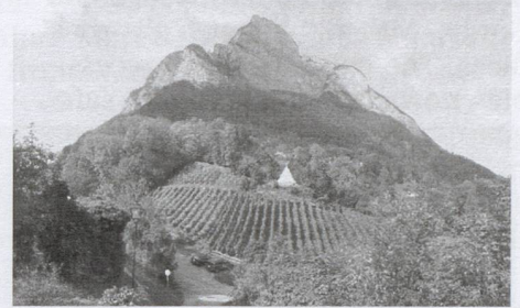
The Gonzen, towering above Sargans

The Gonzen is an impressive rock face towering over Sargans. The rock contains iron and had already been discovered over 2000 years ago, and it was excavated for a long time.