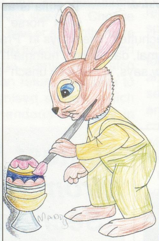
2nd - Maddy Meier (5)