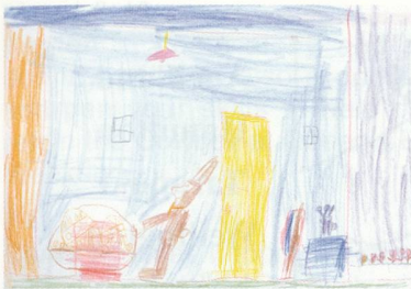
Jonas Padrutt (7)