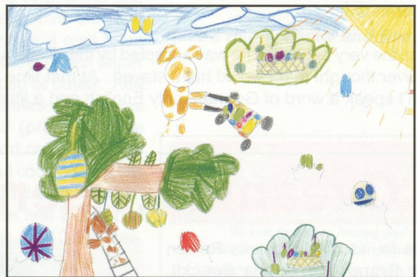
2nd - Celine Russenberger (8)