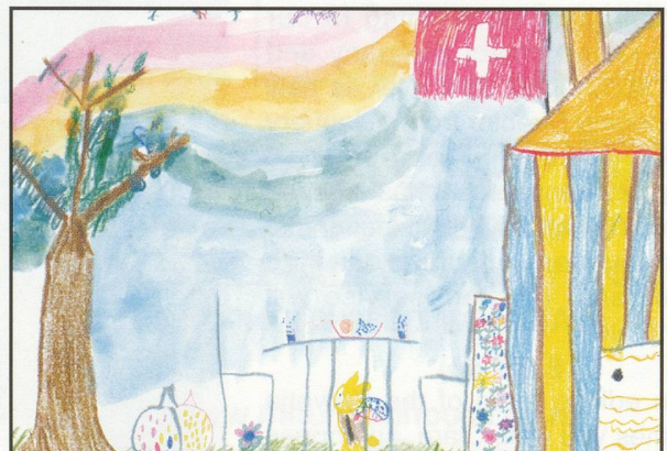
3rd - Rosa-Tui Wallace (7)