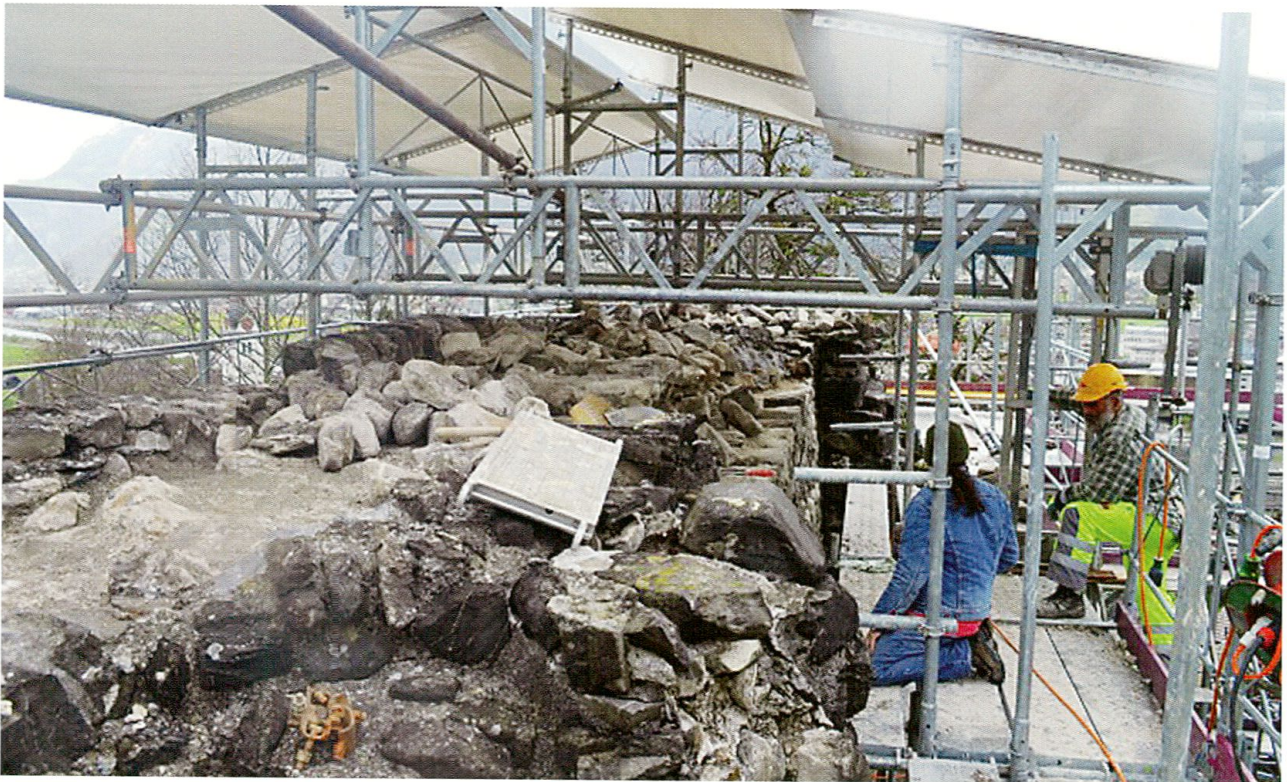
Zwei Fachleute auf dem Gerüst. Die Burg wurde nicht nur kunstgerecht restauriert. Das Mauerwerk wurde gleichzeitig wissenschaftlich untersucht.