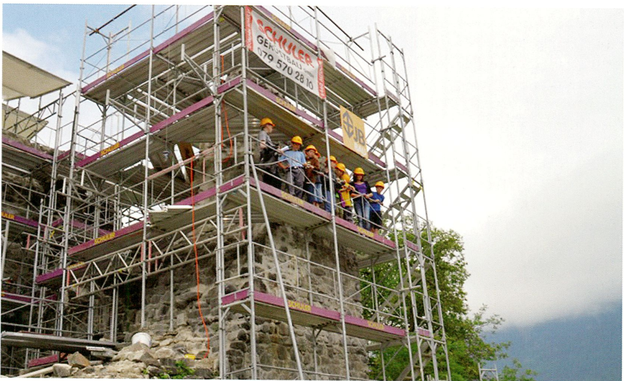
Monatelang war die ehrwürdige Burganlage eingerüstet. Nun ist sie wieder für jedermann zugänglich.