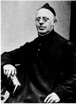
Pater Gerold Zwysig.