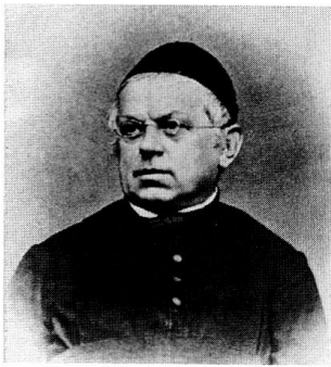
Pater Alois Zwyssig.