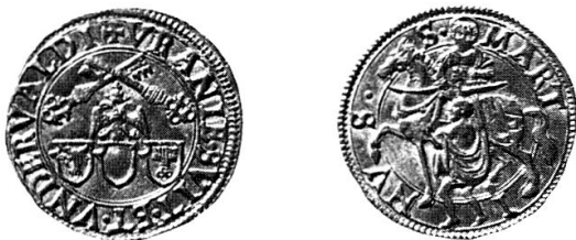
SLM, 3,42 g, 22 mm (Au) †

a Vs. Münzbild ähnlich wie 1; die Form der Wappenschilder variiert