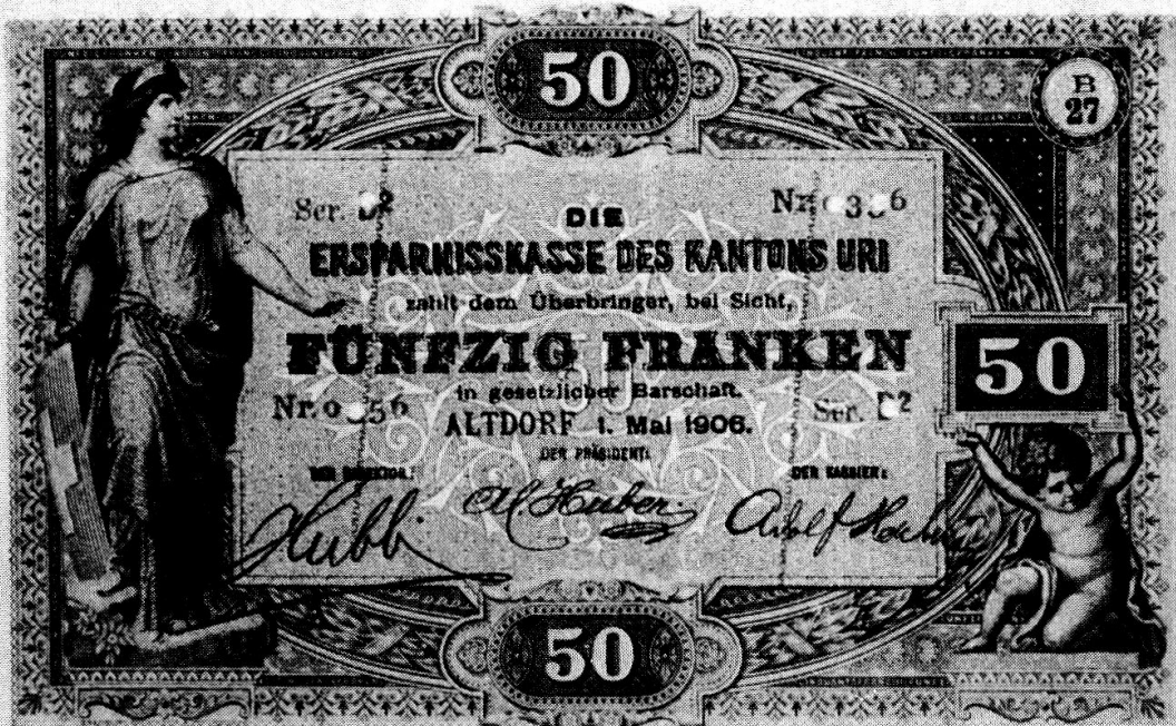
Banknoten der Ersparniskasse Uri vom 1. Mai 1906; oben zu Fr. 100.—, unten zu Fr. 50.—.