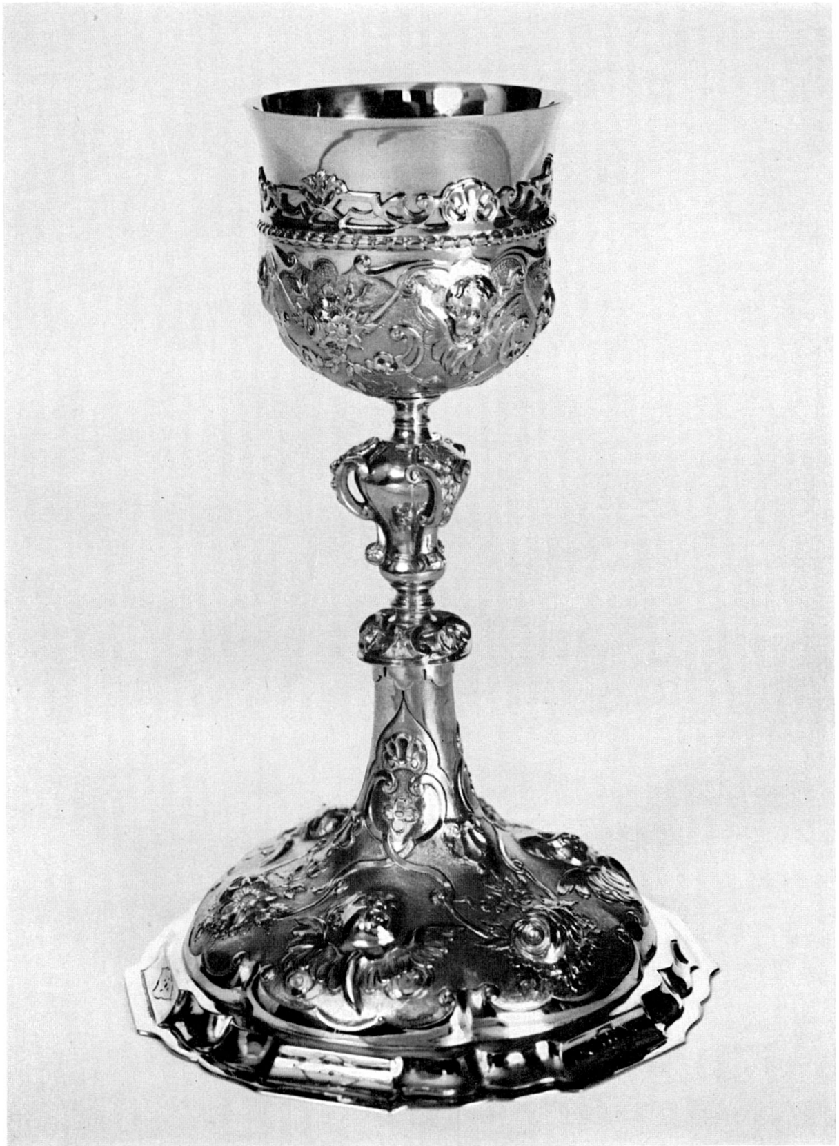
Barocker Kelch aus dem Altdorfer Kirchenschatz. Neuerwerbung.