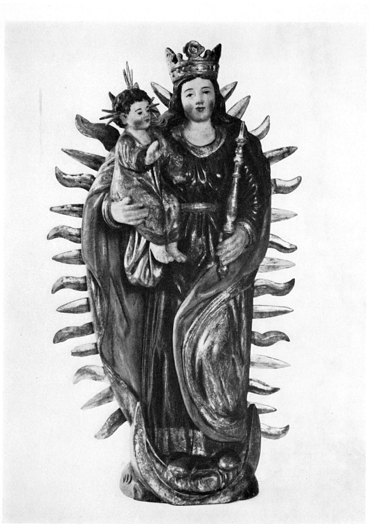
Mutter Gottes mit Jesuskind. Der Meister dieser schönen Statue in der Sakristei der Pfarrkirche St. Martin von Altdorf ist unbekannt.