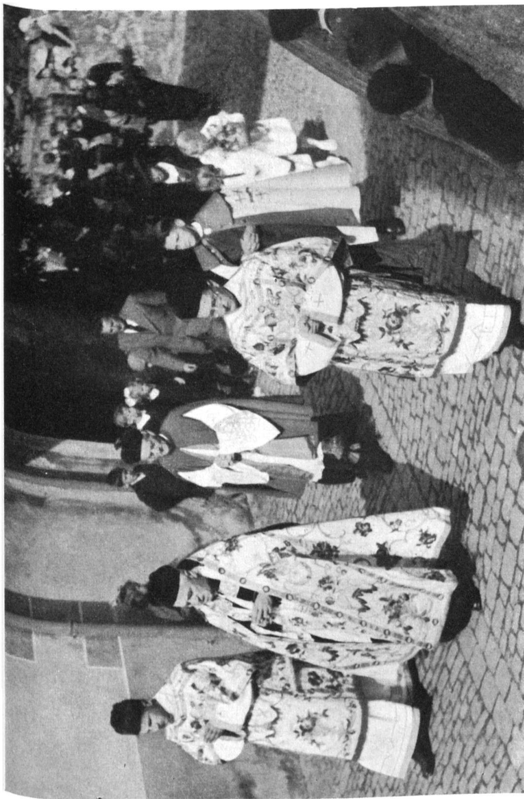
Jubiläumsfeier in Altdorf