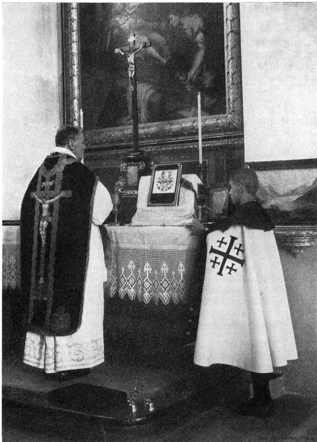
Der Jubilar und sein Altardiener in Beroldingen