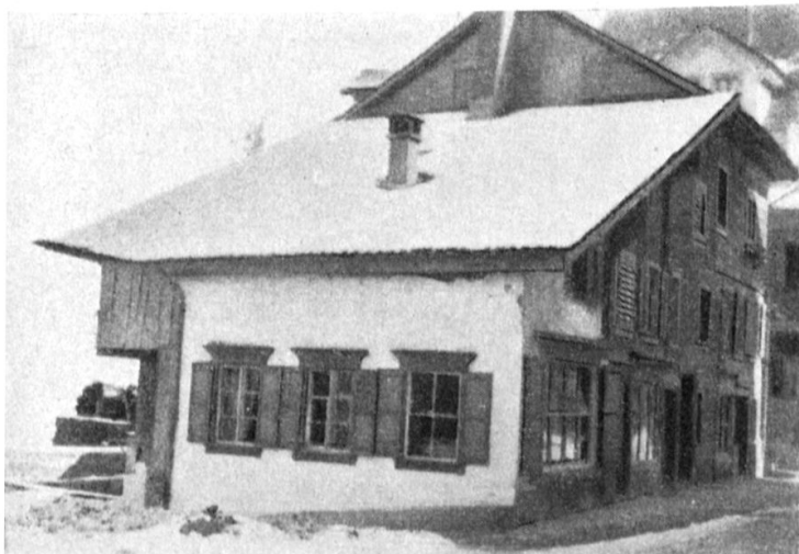
Südseite an der Landstraße und Westanbau über dem Abstieg zur Wehre. An der Südwestecke einst der Lampenladen der Witwe des Bündner Dichters Anton Huonder.