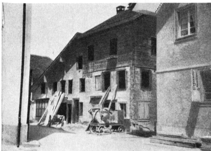
Südseite an der Landstraße zwischen «Röfli» und Post beim Abbruch im April 1929. Von der Bezirksgemeinde erworben den 13. Mai 1928.