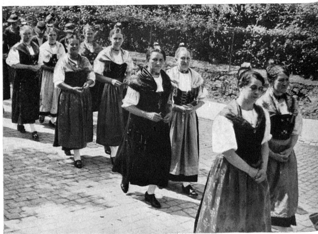
Urner Frauentracht bei der Fronleichnamsprozession in Altdorf

Burschen-, Meitli- und Frauentracht. Die Zweitäußerste links trägt Schächentalertracht.