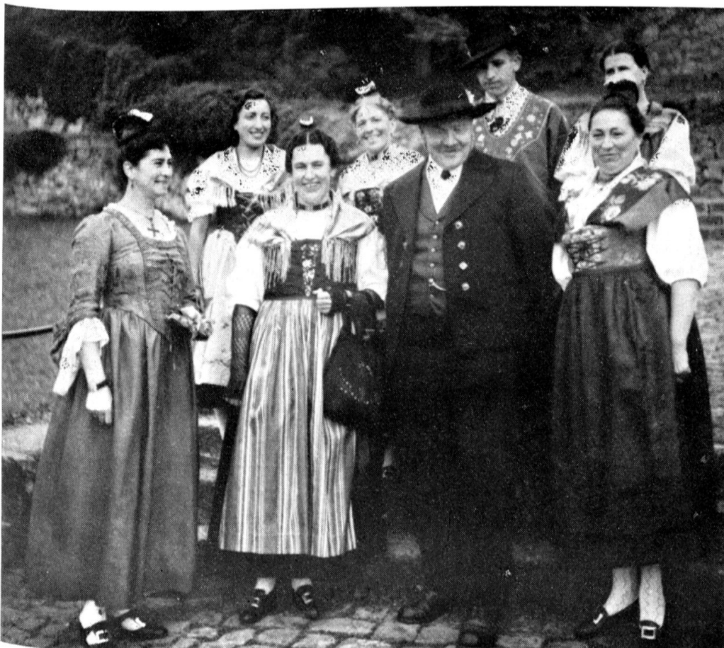
Urner Trachtengruppe mit Ratsherr- und Burschenkostüm

Wie P. Notker Curti in vorgehender Abhandlung ausführt, war die Tracht nicht etwas Starres und Bleibendes, sondern auch den Modelaunen der Frauenwelt unterworfen. So kann sich eine Trachtenbewegung nicht blind gegen alle Zwecke und Ziele fraulicher Bekleidung nur auf den historischen Standpunkt versteifen. Sie wird vielmehr, in Anlehnung an eine historische Form, die dem Geschmack unserer Tage noch am ehesten entspricht, Normen aufstellen, die den persönlichen Einfällen und willkürlichen Auslesen aus allen möglichen Trachten Schranken setzen. Wir zeigen daher in den folgenden Bildern die verschiedenen, heute in Uri getragenen und von der urschweizerischen Trachtenvereinigung anerkannten Arten der Kleidung für die einzelnen Stände.