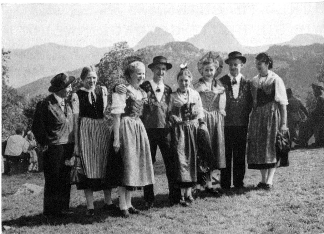
Urner Trachtengruppe auf der Rütliwiese

Burschen-, Meitli- und Frauentracht. Die Zweitäußerste links trägt Schächentalertracht.