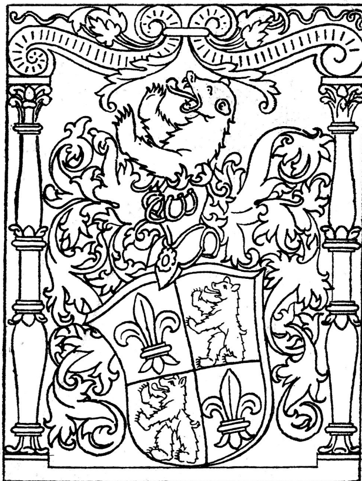
Wappen der Familie Schmid von Uri.