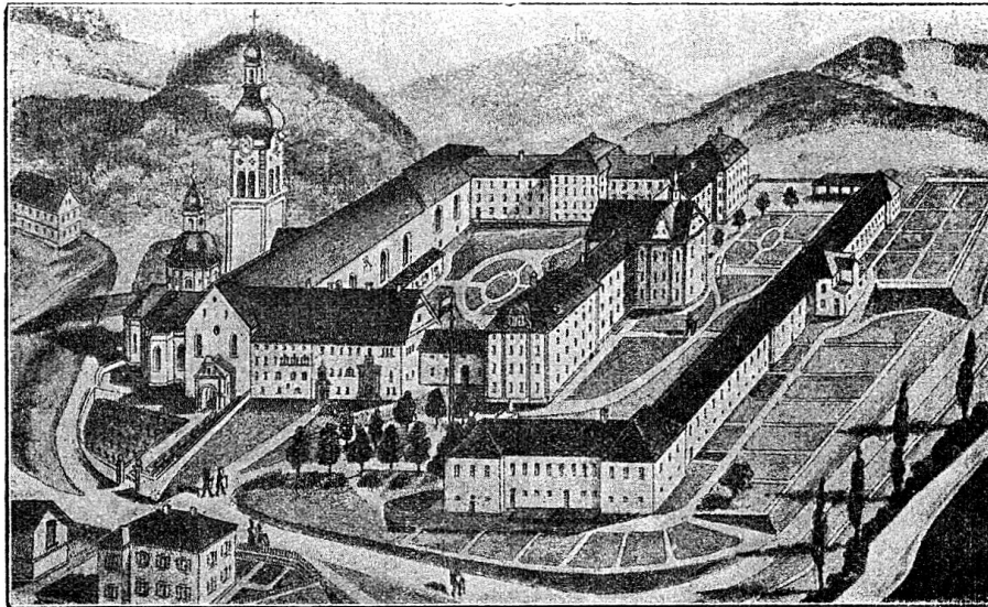
Das aufgehobene Benediktinerkloster in Fischen. Jetzt Waisenanstalt St. Jddazell.