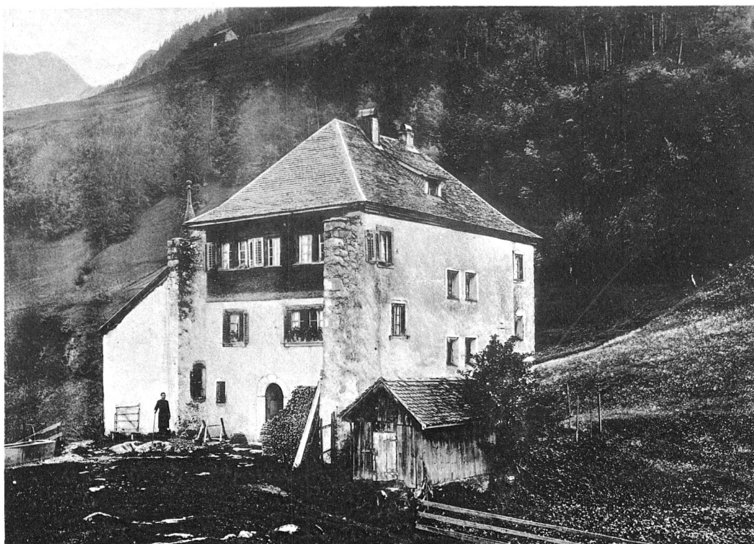
Phot. P. Siegwart 1909