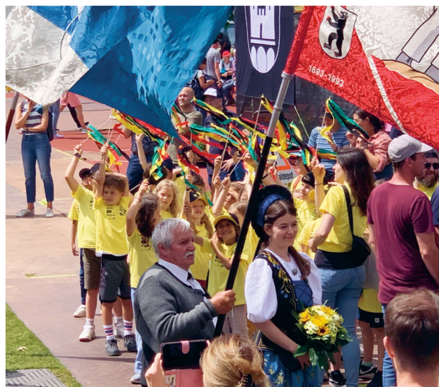
Nordostschweizer Schwingfests auf der Allmend. ↑