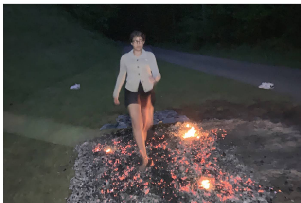
der Firmung. Vorausgegangen war ein spannendes Firmlager samt Feuerlaufen Ende Mai. ↑