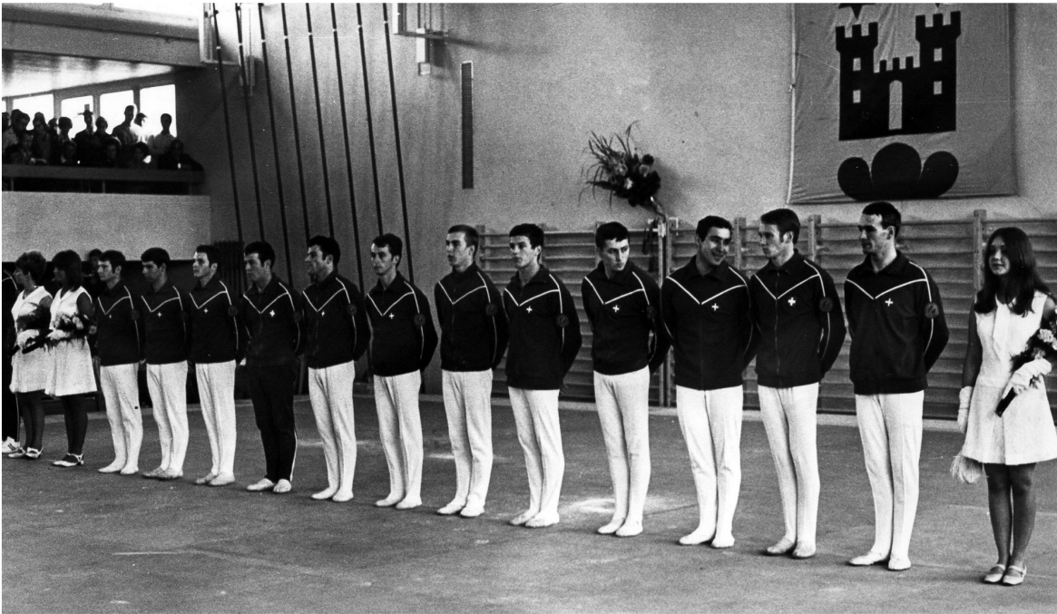
Schauplatz Meilen: Ausscheidung der Kunstturner 1968 für die Olympiade in Mexiko.

der Schwimmclub oder 1978 der Jiu-Jitsu- und Judo-Club. Auch auf turnerischer Ebene erhält der TV Meilen Konkurrenz: In Feldmeilen entstehen ein Männerturnverein (1951) und die Frauengruppe Feldmeilen (1960).