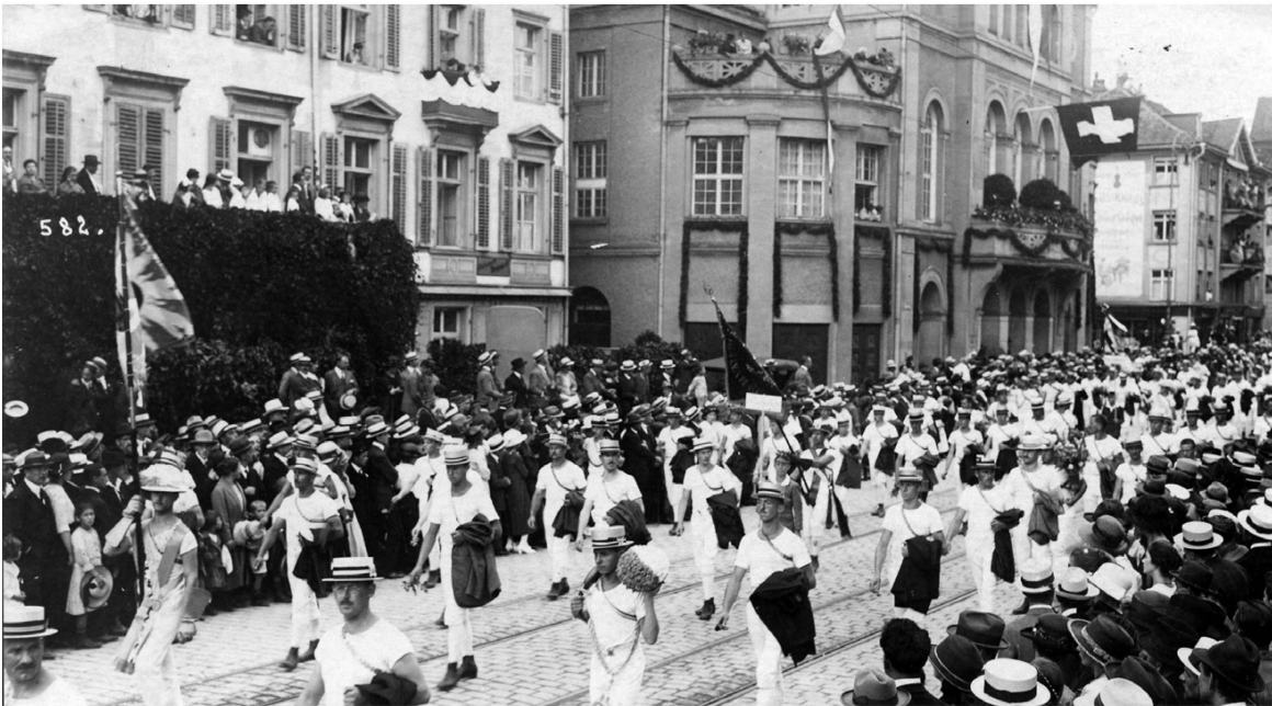
Der TV Meilen im Juli 1922 am Umzug zum Eidgenössischen Turnfest in St. Gallen.

Gründung des Eidgenössischen Turnvereins, der heute Schweizerischer Turnverband STV heisst. 1858 erscheint zum ersten Mal die «Schweizerische Turnzeitung». Mit diesem Organ verstärkt der Eidgenössische Turnverein den landesweiten Zusammenhalt der verschiedenen Vereine und fördert den Aufbau weiterer Sektionen. Eine davon ist der 1868 gegründete Turnverein Meilen.