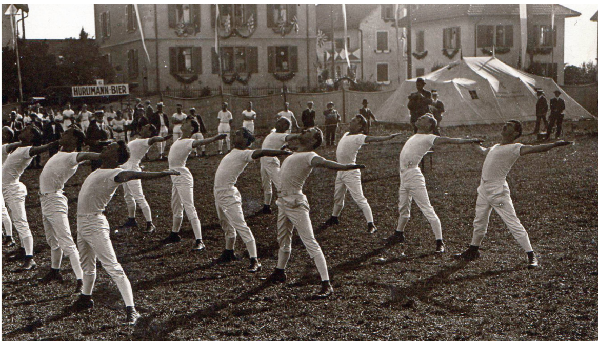
Leibesübungen am Kantonalen Turnfest von 1923 in Oerlikon.

1939 bricht der Zweite Weltkrieg aus. Der TV Meilen – im Dorf längst eine feste und wichtige Grösse – lässt sich dadurch nicht vom Kurs abbringen. 1940 engagiert er sich im Sportplatzverein, der – auf private Initiative gegründet – das Ziel verfolgt, in Meilen einen Sport-