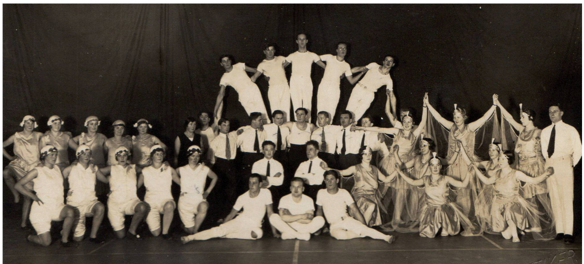
Abendunterhaltung des TV Meilen im Restaurant Löwen 1929.

Im 19. Jahrhundert werden insgesamt rund 30'000 Vereine gegründet, die Hälfte davon zwischen 1880 und 1900. Um 1900 fallen auf 1'000 Einwohner in der Schweiz zehn Vereine. Dieser Trend setzt sich in der ersten Hälfte des 20. Jahrhunderts fort, die Mitgliedschaft in Vereinen wird in der Schweiz praktisch zur «Pflicht». Erst eine Vereinsmitgliedschaft habe, so der Historiker Hans-Ulrich Jost, den Schweizer zu einem Bürger im vollen Sinne des Wortes werden lassen. Die Turnvereine stehen hier ganz vorn: Ihre Feste sind durchtränkt von patriotischem Pathos. Alles ist straff, ja nahezu militärisch organisiert. Die Turner verstehen