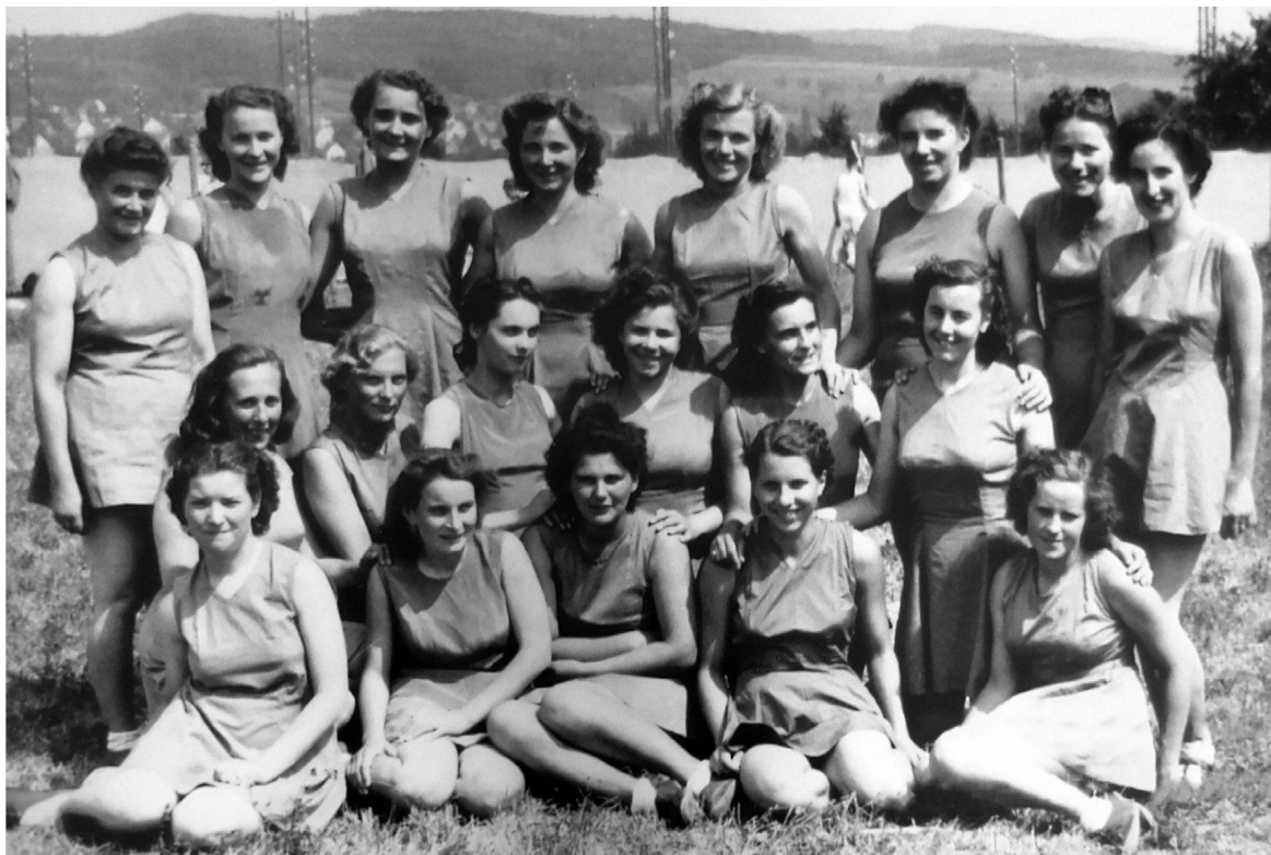
Der Damenturnverein von Meilen in den 1920er Jahren.