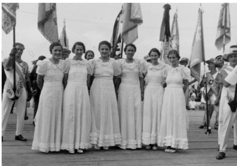
Frauen als Ehrendamen bei einem Aufzug des TV Meilen in den 1920er Jahren.

nun schrittweise. Schon 1924 ist ein eigenständiger Damenturnverein gegründet worden, der aber nur ein Jahr Bestand hat. Es dauert drei Jahre, bis ein neuer Anlauf unternommen wird. 18 Frauen zählt der neue Verein im ersten Jahr. 1946 – eher etwas spät im kantonalen Quervergleich – wird die Damenriege um eine Mädchenriege ergänzt.