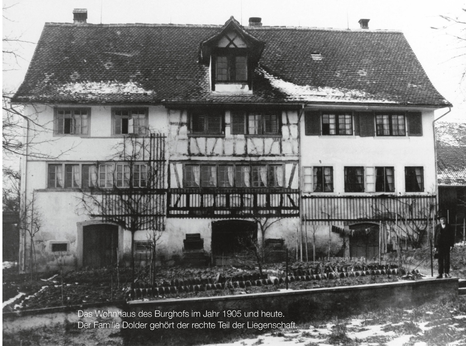
Das Wohnhaus des Burghofs im Jahr 1905 und heute. Der Familie Dolder gehört der rechte Teil der Liegenschaft.