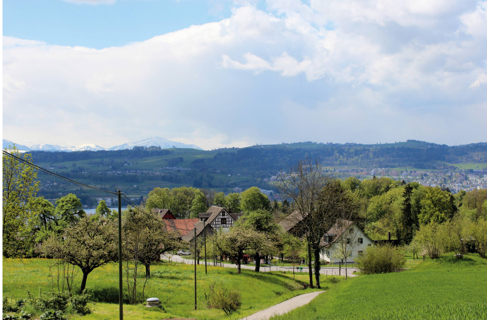
Der Burghof im Weiler Burg unterhalb von Toggwil.

die sich das Landwirtschaftsland teilen. Und während 1939 noch 428 Menschen von der Landwirtschaft lebten, sind es 2015 nur mehr 44 Vollzeit- und etwa nochmals so viele Teilzeitbeschäftigte.