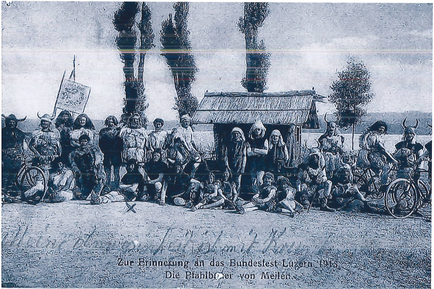
Die Meilemer Velofahrer 1913 als Pfahlbauer.

Die frühen Jahre Das älteste vorhandene Fotodokument datiert aus dem Jahre 1910 und zeigt die Vereinsmitglieder vor dem Start des Klubrennens Meilen–Tiefenbrunnen–Meilen. Damals gab es weder Carbonrahmen noch Velohelme, und die Seestrasse war als Naturstrasse eine staubige Angelegenheit. Geteert und gepflästert wurde sie erst ab den zwanziger Jahren.