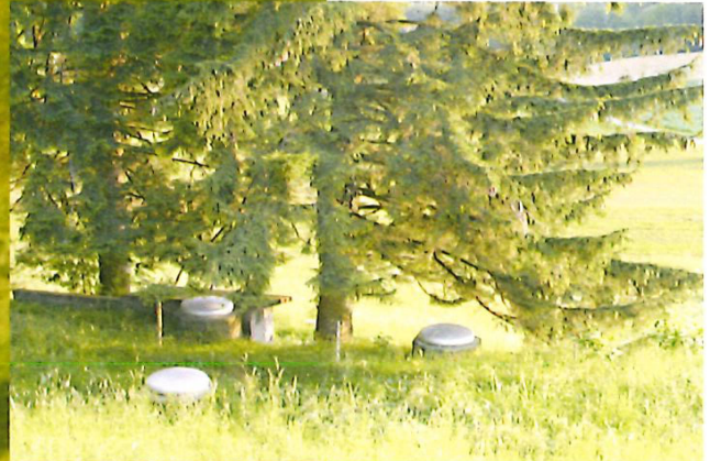
Sicht von einer Brunnenstube zum Reservoir mit den prägenden Tannen.