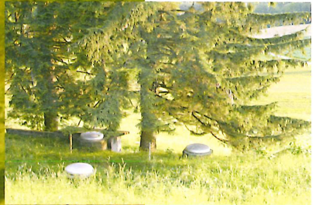
Sicht von einer Brunnenstube zum Reservoir mit den prägenden Tannen.