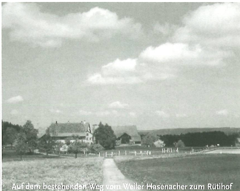
Auf dem bestehenden Weg vom Weiler Hasenacher zum Rütihof