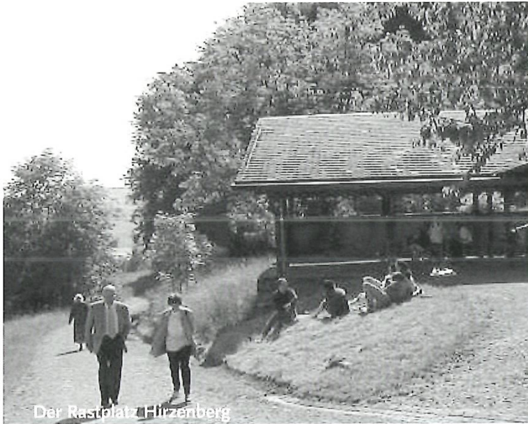
Der Rastplatz Hirzenberg