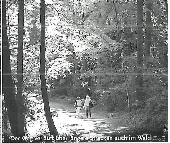
Der Weg verläuft über längere Strecken auch im Wald

1968 die Idee: Ein Aussichtsweg Vorderer Pfannenstiel – Rütihof – Forch Ein Vorstoss des Verkehrs- und Verschönerungs- vereins Meilen (VVM)