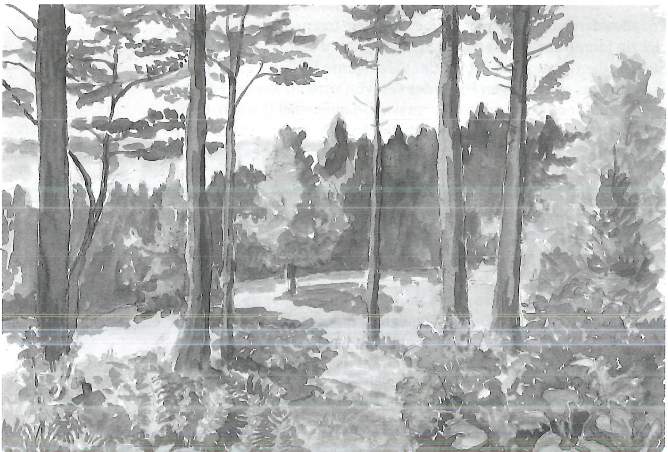
Waldlichtung am Pfannenstiel. Aquarell von Hans Pfenninger.

Nach dem Fällen erstellte das Forstamt jeweils einen Kulturplan, worin genau festgeschrieben wurde, wie viele Bäumchen pro Are angepflanzt werden mussten. In den Jahren danach war die aufgeforstete Waldfläche von Unkraut freizuhalten. Dass natürlich nicht alle Waldeigentümer diese Arbeiten gerne und freiwillig erledigten, ist begreiflich. Immer wieder musste die Forstkommision mündlich und schriftlich Mahnungen erteilen oder Bussen anordnen. Meis-