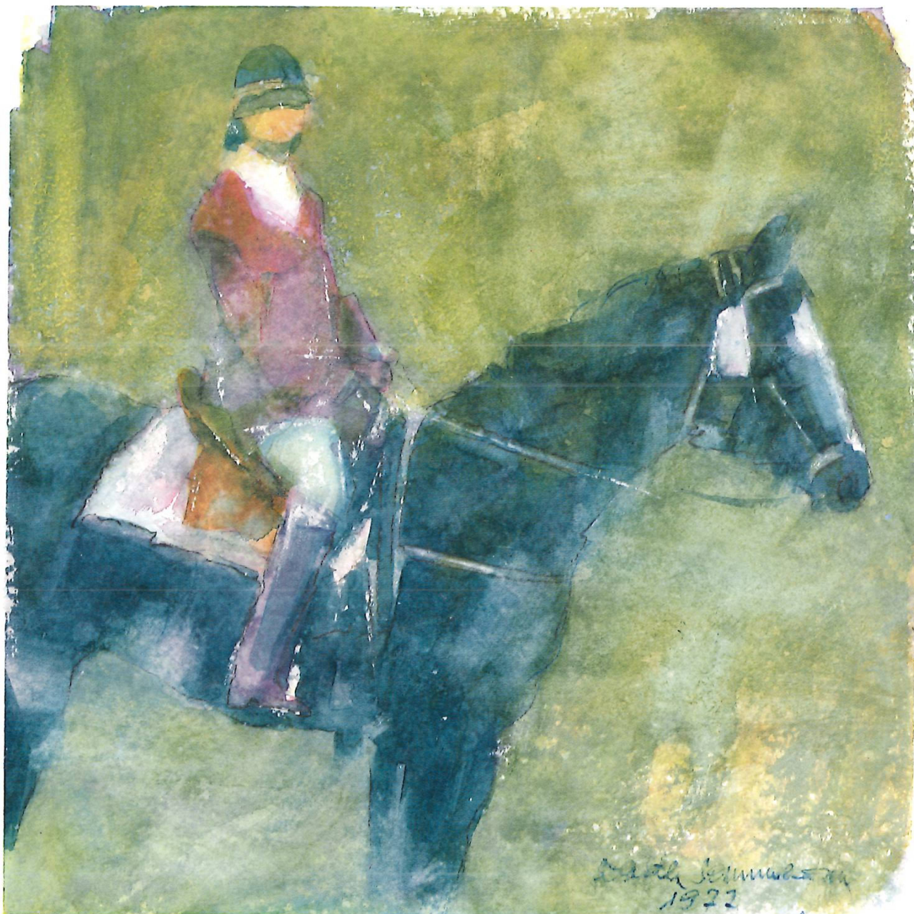
Reiterin vor dem Turnier, Aquarell 1977, 40 × 40 cm.

Wenn Kunstschaffende über sich selbst schreiben, ist oft eine gewisse Scheu und Schüchternheit vorhanden, manchmal sogar Angst, sich vor aller Öffentlichkeit exponieren zu müssen.