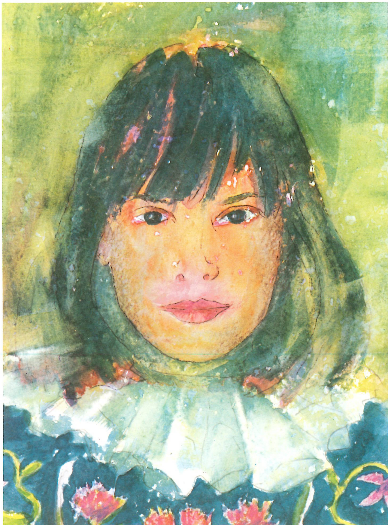
Mädchen in Engadinertracht, Aquarell 1981, 33 × 47 cm.