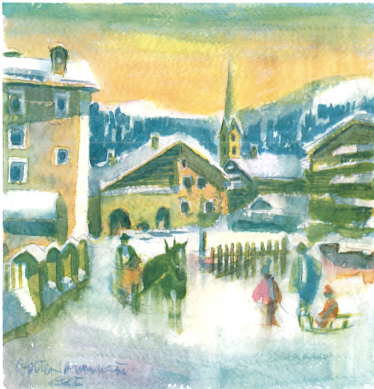
Februarmorgen in S-chanf (Engadin), Aquarell 1985, 48,8 × 46,6 cm.

zu den hier gezeigten Bildern: Hinschauen können, zuhören können, Neues entdecken wollen, erzählen mögen, Wiederholungen nicht scheuend, wenn sie eine Aussage betonen sollen, und mit kindlicher Freude gestaltend bleiben, es sei in Bild, Schrift oder menschlicher Beziehung. Ich erinnere mich an einen Ausspruch – er wird Picasso zugeschrieben –: