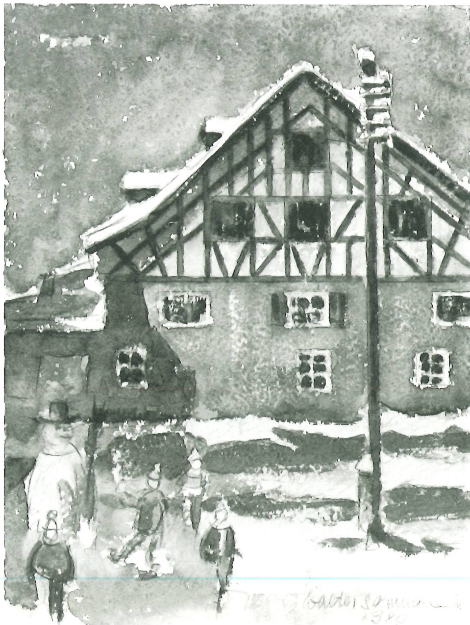
Haus «untere Mühle» (Familie Wunderly) im Grund, Winter 1980, Aquarell 37,5 × 28,5 cm.