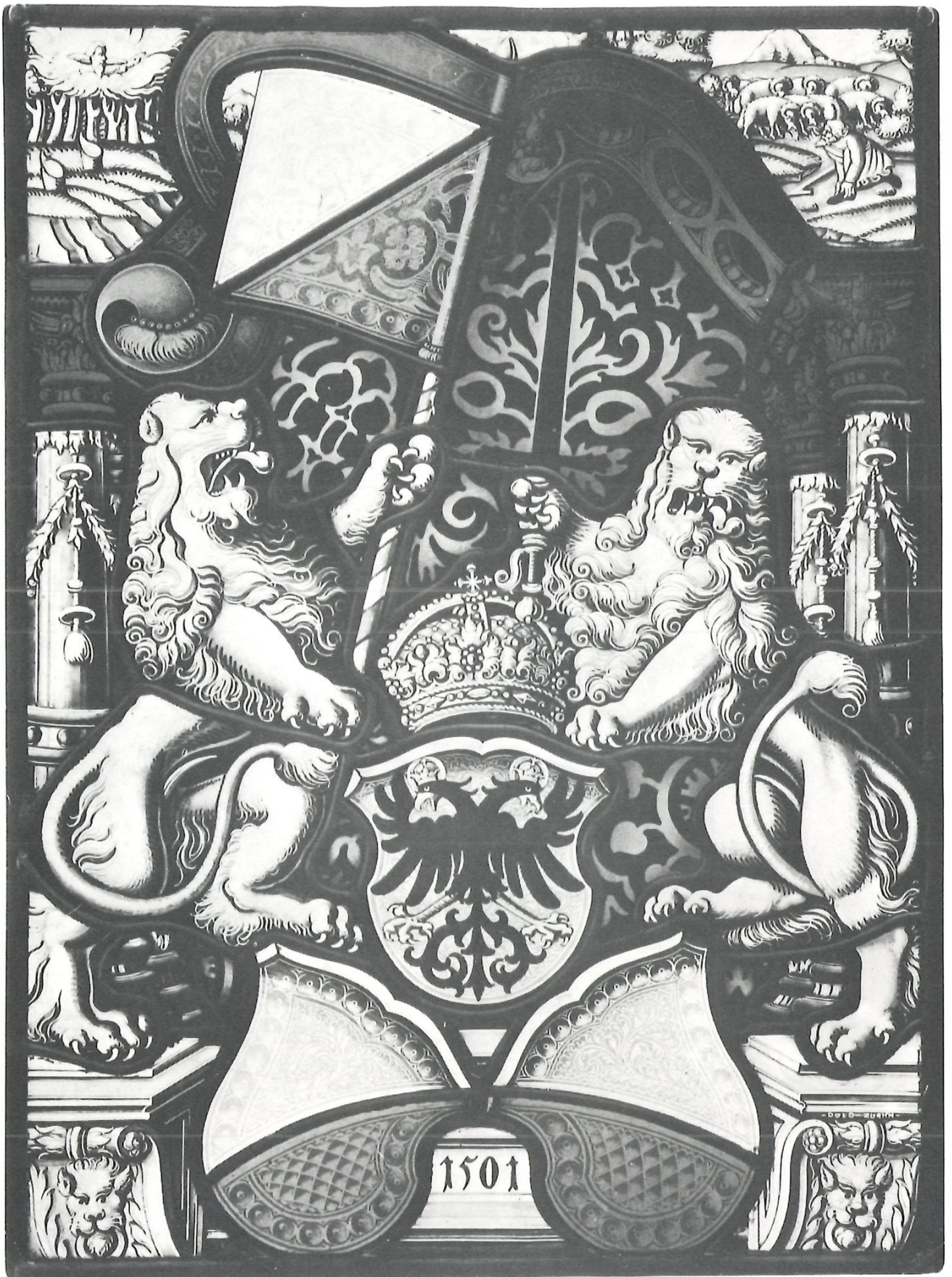
Standesscheibe der Stadt Zürich, 1501, Original im Landesmuseum. Der Glasmaler befasst sich mit sorgfältigen Kopien antiker Scheiben.

Seite 127: Komposition «Geborgen in der Kälte»