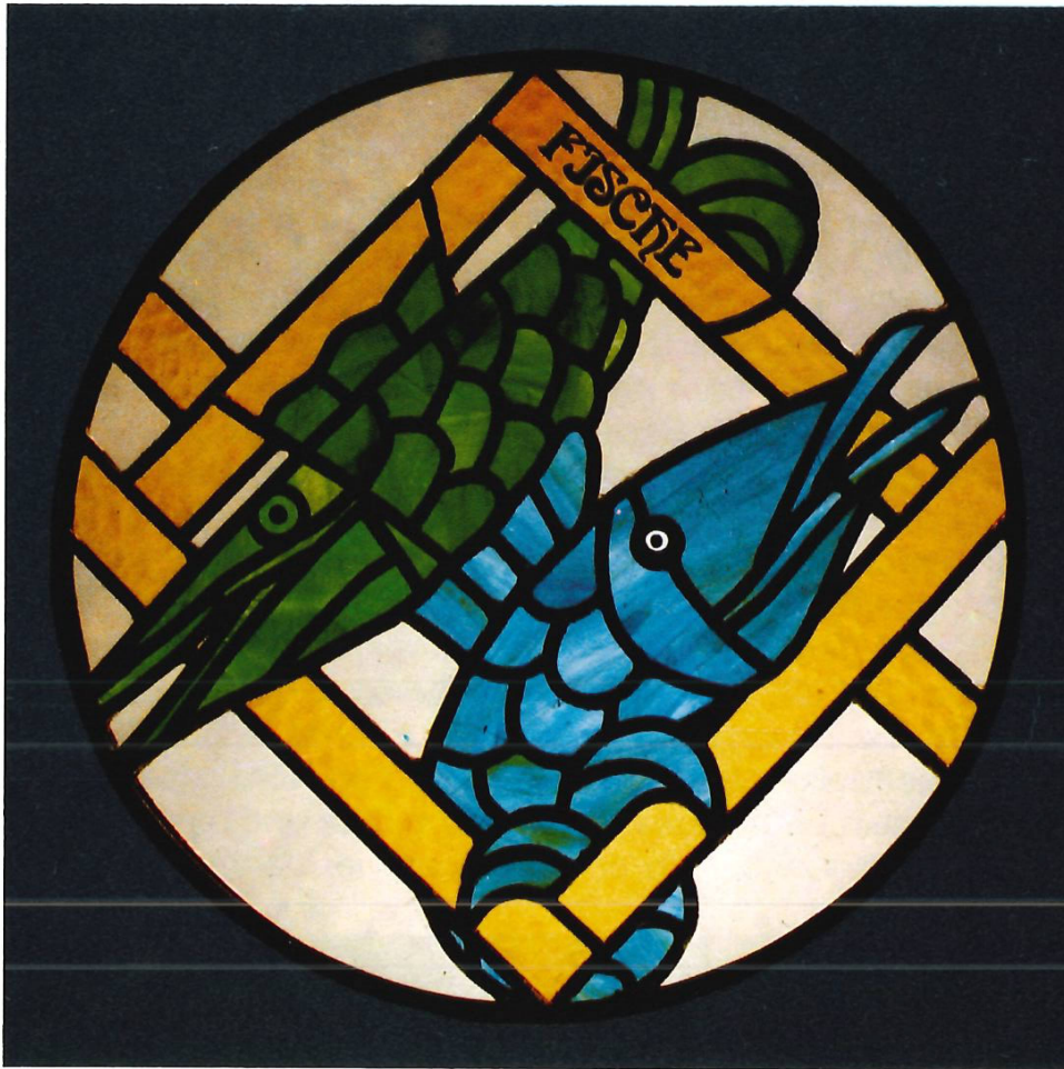
Sternzeichen- scheibe aus Spezialgläsern, «Fische».