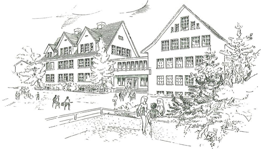
Sekundarschulhaus seit 1952.

von Rekursen verzögerten den Baubeginn nochmals um ein halbes Jahr, bis am 21. März 1951 die ersten Bauarbeiten vergeben werden konnten. Am 26. April 1952 konnte die Sekundarschule einziehen, und nach Aussenrenovation des alten Primarschulhauses wurden am 24. August 1952 Alt- und Neubau eingeweiht.