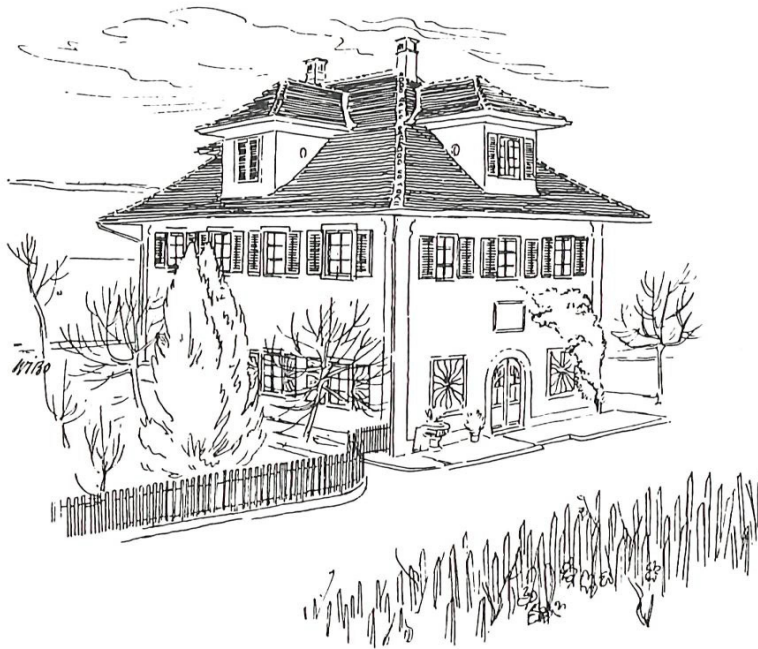
«Untere Seehalde», Ausweichschulzimmer von 1872–1883.

Herrliberg amtierte nach vier Vorgängern Oberst Ulrich Wille, der nachmalige General, von 1901–1906 als Sekundarschulpräsident. Bis 1862 wurden die Schulpfleger bei ihrem Amtsantritt vereidigt, ihr Amt wurde damit als ernste Verpflichtung gewürdigt.