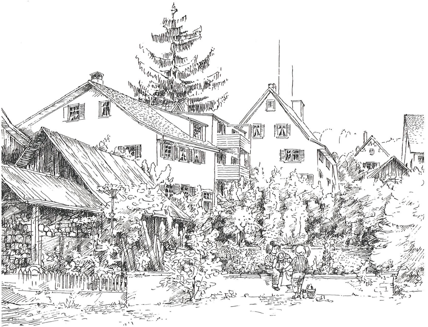
Westlich grenzt das heutige Sekschulhaus mit seinem Pausen-(und Chilbi-)platz an die Liegenschaften der mittleren Kirchgasse.