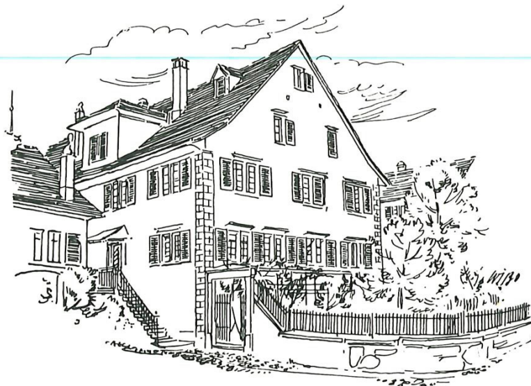
Der «Bau» an der Kirchgasse, Heim der Sekundarschule von 1834 bis 1860.

In den ersten Jahren bildete die ungleiche und ungenügende Vorbildung der Primarschüler eine Erschwerung der Schularbeit. In falsch verstandener Bildungseifer wurden der Schule zu junge Schüler zugewiesen, hält doch der Schulbericht vom Jahre 1837/38 fest, dass von 39 Schülern deren 10 erst elfjährig waren, einer «fast neun Jahre alt». Unter diesen Umständen ist es klar, dass die Leistungen der Sekundarschule hinter den hochgespannten Erwartungen der Bevölkerung zurückblieben. Die geheim wirkenden Gegner befürchteten laut Schulbericht, die Schule könnte die jungen Leute zu klug machen oder, weil sie das «Lernen als süßes Nichtstun anschaute», «die Schule verweichliche die Schüler und entwöhne sie der Arbeit». Zudem verursache die Sekundarschule der Gemeinde Meilen alljährlich ein paar hundert Franken Kosten.