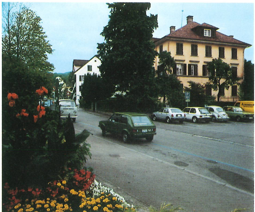
Das Ortsmuseum heute.