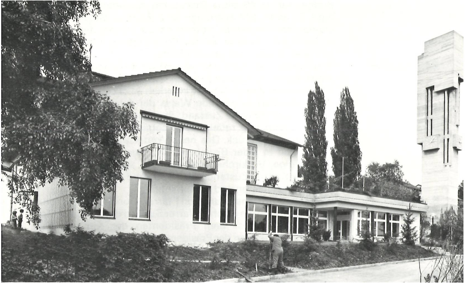
Die katholische Kirchgemeinde hat das Pfarrhaus (links) umbauen und einen Pfarreisaal (Bildmitte) errichten lassen. Einweihung am 20. und 21. Mai 1978.

Auch beim Kirchengut ein Brutto-Einnahmenüberschuss! 12. Juni Das erfahren 39 reformierte Meilemerinnen und Meilemer an der diesjährigen Rechnungsgemeindeversammlung der reformierten Kirchenpflege. Der Überschuss beläuft sich auf Fr. 117 471.—.