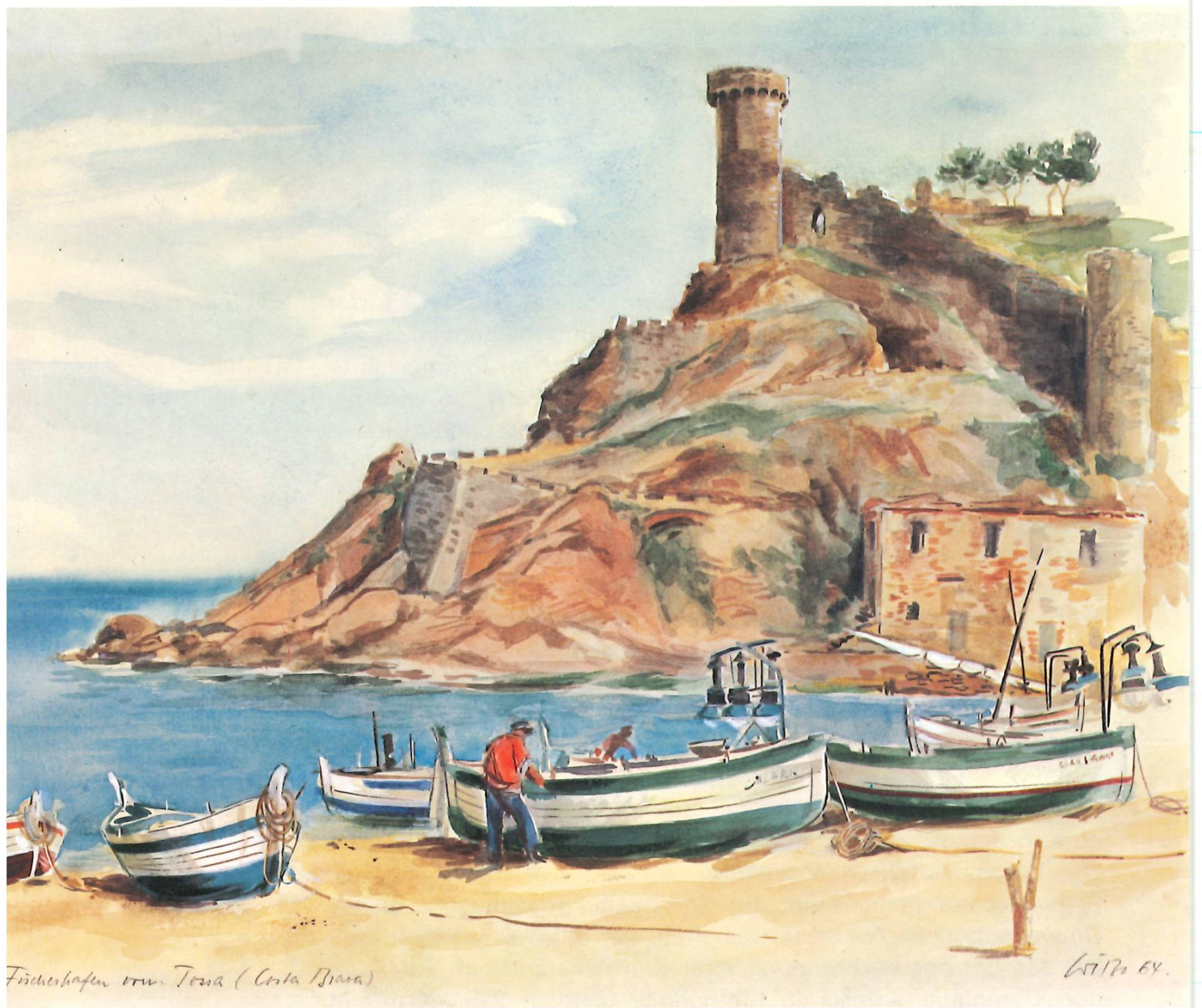
«Fischerhafen von Tossa (Costa Brava)», Aquarell 1964. Seite 100: «Im Höchlig», Aquarell aus der Sekundarschulzeit des Grafikers W. Bolleter. Weitere Abbildungen Seiten 33, 104/05, 108, 112 und 133.