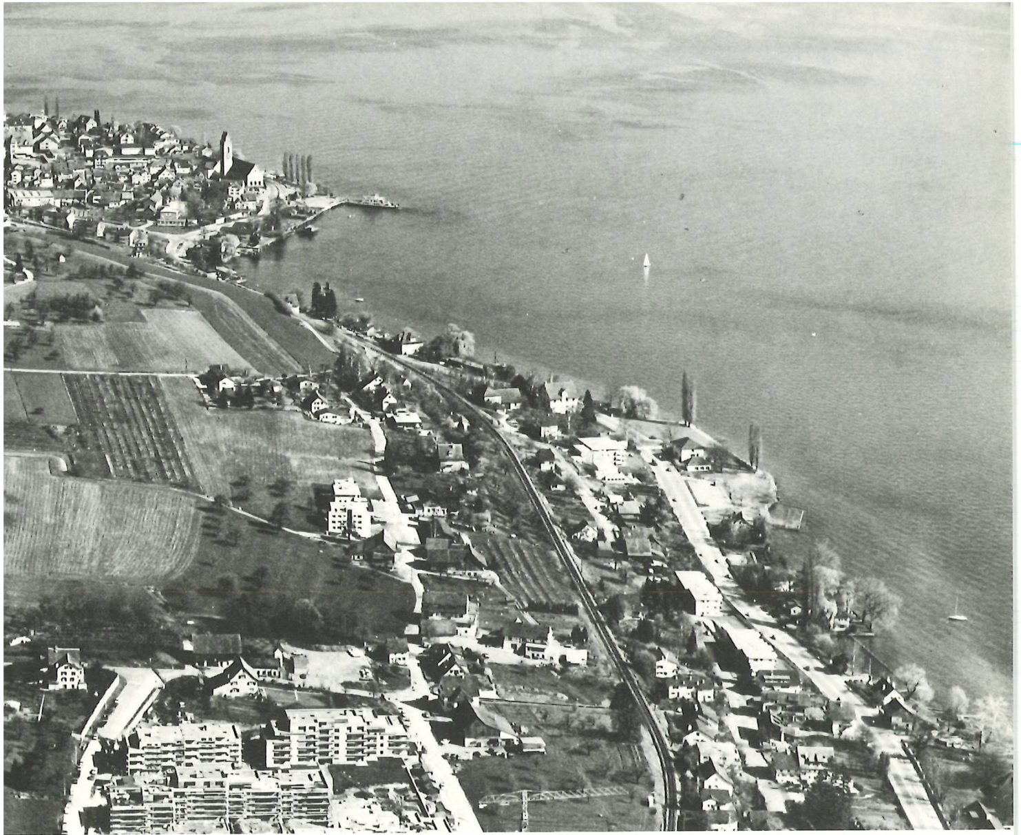
Flugaufnahme vom Frühjahr 1975. Am untern Bildrand ein Teil der neuesten Überbauung, zwischen Schulhaus und Schwabach. Im Hintergrund Dorfmeilen. (Man vergleiche hiezu S. 7).