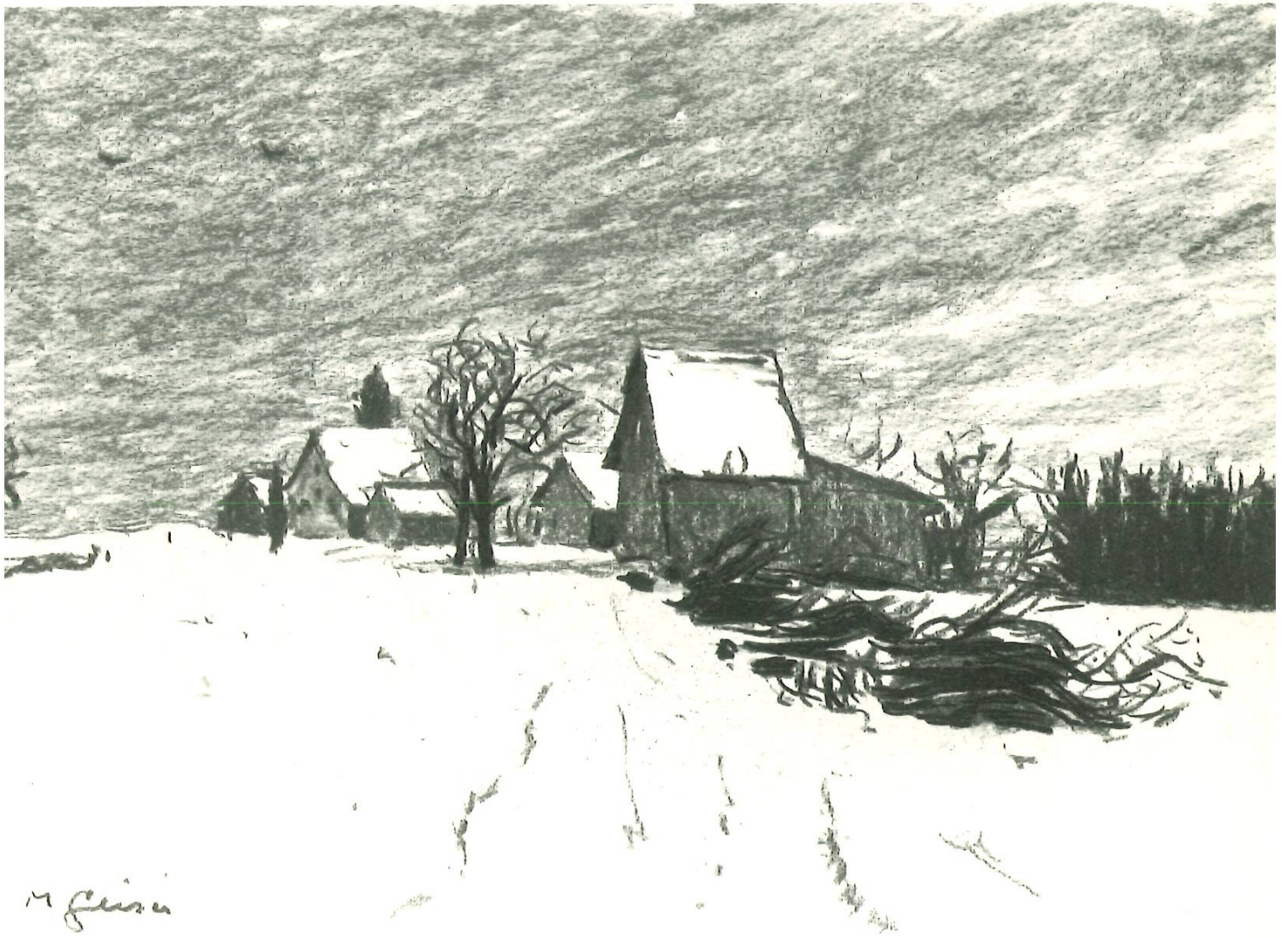
M. R. Geiser Buechstud 1961 (Kohle)