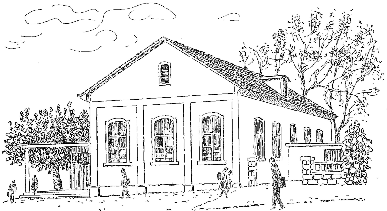
Die Turnhalle von Dorfmeilen, wie sie sich 1928 bis 1960 präsentierte.

1928, nachdem die Turnhalle Schule und Vereinen drei Dutzend Jahre gedient hatte, war eine gründliche Renovation nötig. Vorgeslagen wurde ein Anbau mit Bühne und zwei Kindergarten-zimmern, beschlossen und unter dem Schulpräsidium von Dr. med. H. Frey durchgeführt eine gründliche Erneuerung mit Anbau von Garderobe, Geräteraum, Toilettenanlagen und Velostand, mit Erneuerung des Bodens und des Dachstuhles, im Kostenbetrag von Franken 85 000.—. Und heute, nochmals 32 Jahre später, ist der Zustand der sozusagen in jeder möglichen Schulstunde und jeden Abend benützten Halle derart, dass der Abbruch und ein vollständiger Neubau unaufschiebbar geworden sind.