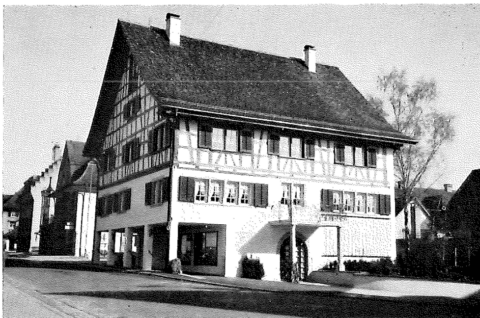
Das «Rothaus» nach der Renovation von 1960. Links hinter dem «Rothaus» ist das nun abgebrochene Gebäude des Landwirtschaftlichen Vereins zu sehen. (s. Chronik S.108)