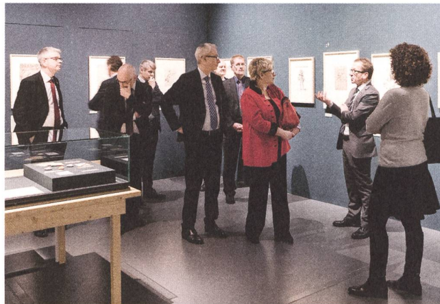
Der Berner Regierungsrat in Niklaus Manuels Zeichnungswerkstatt.

Im Dezember 2017 besuchte der weissrussische Vize-Aussenminister Oleg Kravchenko in Begleitung der stellvertretenden Staatssekretärin Krystyna Marty des Eidgenössischen Departements für auswärtige Angelegenheiten (EDA) das Einstein Museum. Nach der Führung mit dem Direktor hielt der Vize-Aussenminister aus Weissrussland im Gästebuch fest, dass er sich privilegiert fühle, Wissenswertes jenseits des allgemein Bekannten über diesen vielleicht einflussreichsten Wissenschaftler der Welt erfahren zu haben. Es folgte der Besuch der Aussenministerin der Republik Andorra Maria Ubach Font in Begleitung von Botschafter Nicolas Brühl, Chef der Abteilung Europa in der Politischen Direktion des EDA. Auch die andorranische Aussenministerin bedankte sich «infiniment» für die anregende Führung mit einem Gästebucheintrag.