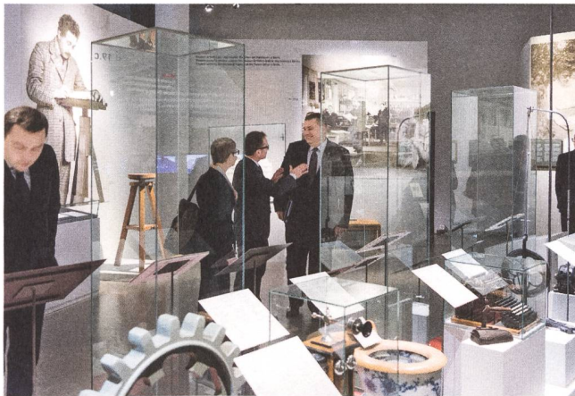
Der Vize-Aussenminister der Republik Weissrussland, Oleg Kravchenko, im Dialog über Albert Einstein.