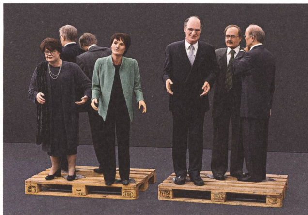
Der Bundesrat, wie er 2002 an der Expo in Biel/Bienne zu sehen war, in der Ausstellung.