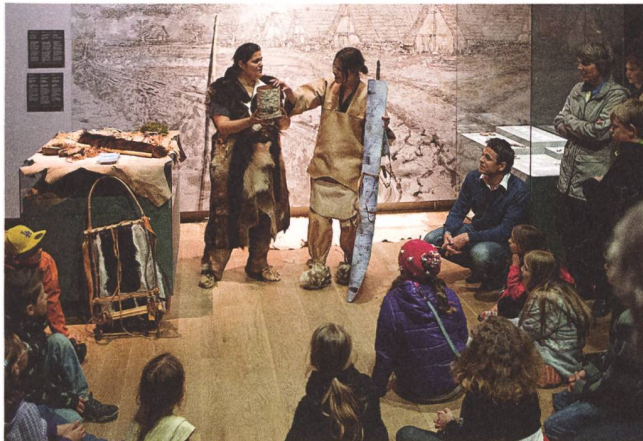
Zeitreise in die Bronzezeit.