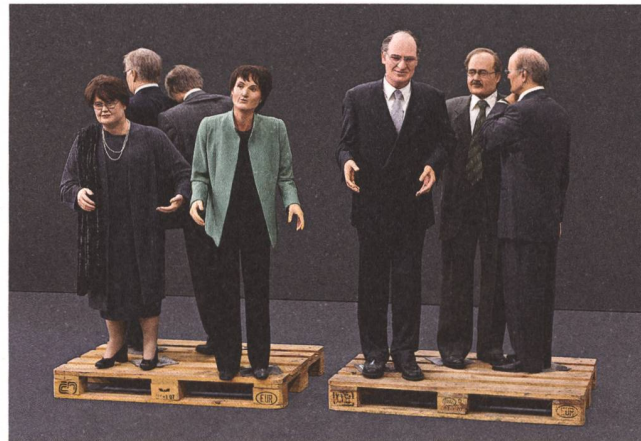
Der Bundesrat, wie er 2002 an der Expo in Biel/Bienne zu sehen war, in der Ausstellung.