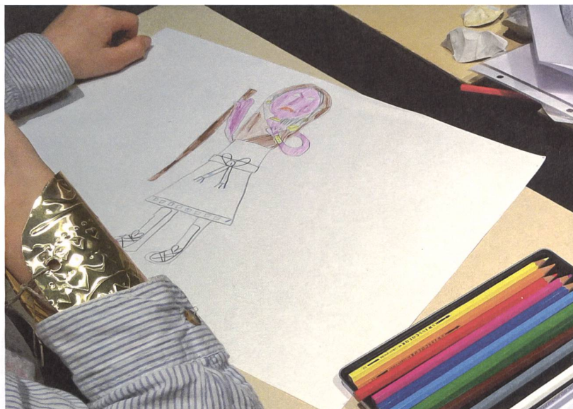
Ausstellungseröffnung aus Kinderoptik