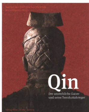
Maria Khayutina (Hrsg.): Qin – Der unsterbliche Kaiser und seine Terrakottakrieger. Bernisches Historisches Museum und Verlag Neue Zürcher Zeitung, Zürich 2013.

Der Begleitband «Qin – Der unsterbliche Kaiser und seine Terrakottakrieger» zur gleichnamigen Ausstellung vermittelt in thematischen Beiträgen von namhaften internationalen Autoren einen Eindruck von der Welt des Ersten Kaisers und der Entstehung Chinas. In prächtigen Bildern lässt er die chinesische Geschichte aufleben und widmet sich in drei Teilen dem Aufstieg Qins vom Fürstentum zum Kaiserreich, der Grabanlage und ihren Terrakottakriegern sowie dem Vermächtnis des Ersten Kaisers an nachfolgende Kaiserdynastien.