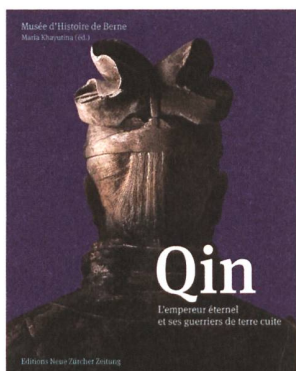
Maria Khayutina (éd.): Qin – L'empereur éternel et ses guerriers de terre cuite. Musée d'Histoire de Berne et Editions Neue Zürcher Zeitung, Zurich 2013.