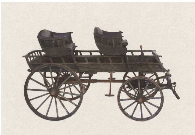
Berner Wagen mit schwingend aufgehängten Sitzen, um 1820/40.