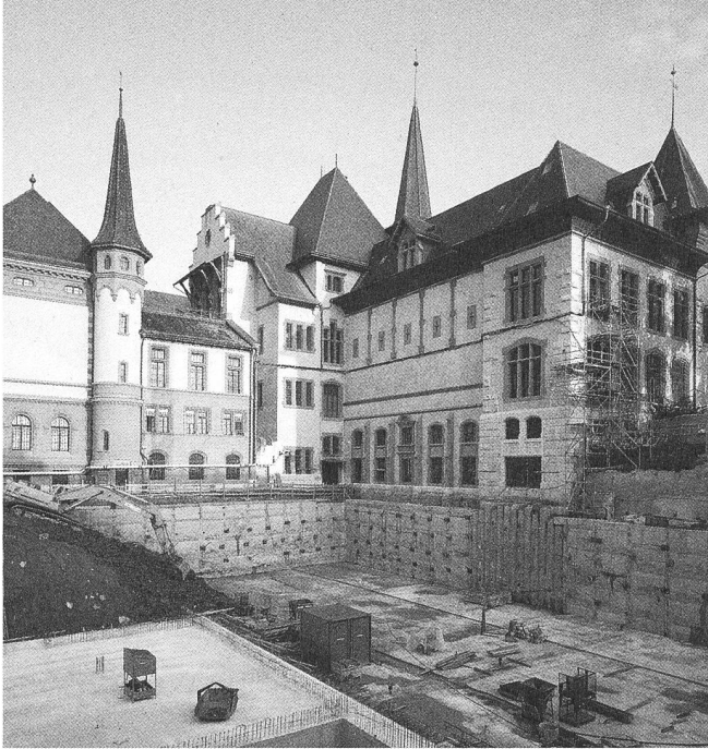
Die Depotgeschosse liegen unter dem Ausstellungssaal im Boden.