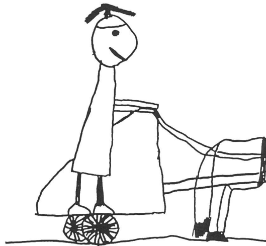
Der keltische Streitwagen ist in wesentlichen Zügen erfasst – das Pferd entzog sich der vollständigen Wiedergabe!