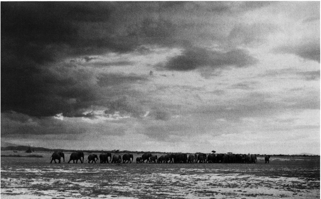
Tafel 2. Amboseli-Nationalpark, Kenia

In fast geschlossener Front nähert sich eine Elefantenherde (oben), biegt dann rechtwinklig ab und wandert mit Breitseite-Bieten in langer Kolonne weiter (unten).