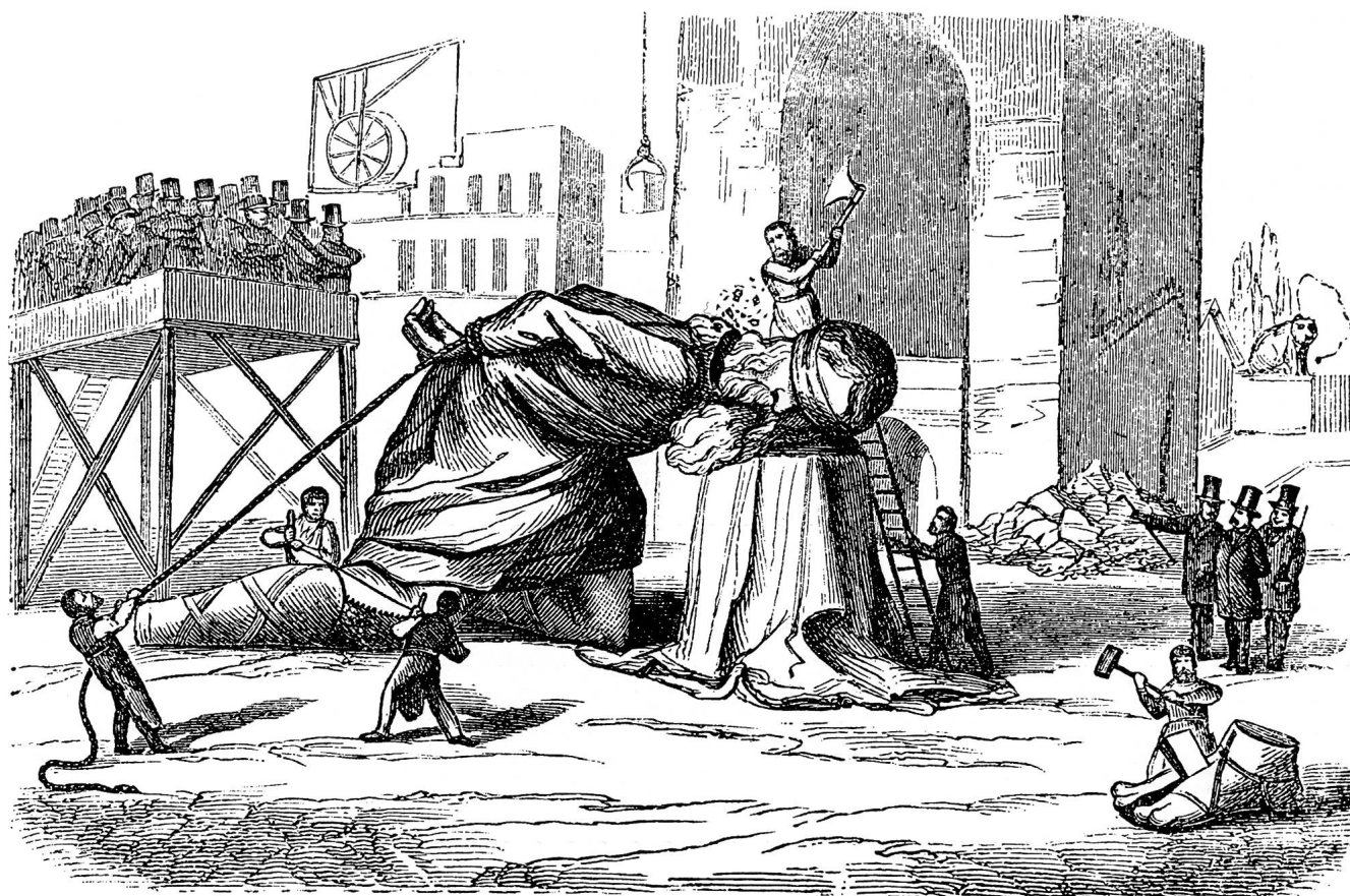
Abb. 69: «Als wie der größte Mann Berns auf Befehl der kleinen Götter des Materialismus geopfert und enthauptet wird.» Die Schweiz . Illustrierte Zeitschrift für schweiz. Literatur, Kunst und Wissenschaft, März 1865, Nr. 3.

Das Restaurations-Comite für den Christoffelthurm.