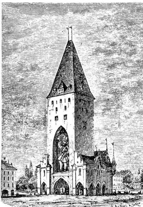
Ansicht des Christoffelthurmes

Und ohni Christoffel — wie wett es de gab? Die Laube, die würd' me verliere 5) , Es wäre de d'Lüt g'rad nie übler dra, Me möchti's so schön no verzieren. So Nütschich's ga g'schände für d'Pretension, Das thät nit der Cheiser Napoleon.