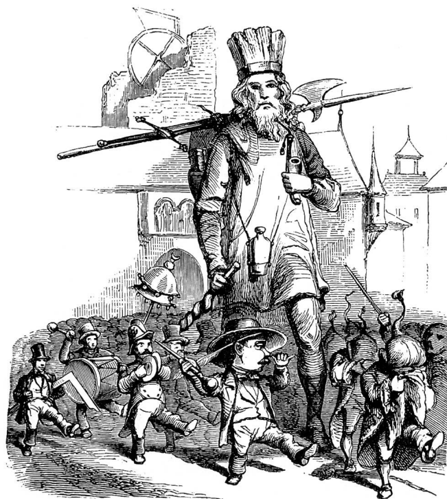
Abb. 45. Illustrierte Wochenzeitung 18. 4. 1863.: «Christoffels Abschied von Bern» am 7. 4. 1863. Holzstich.