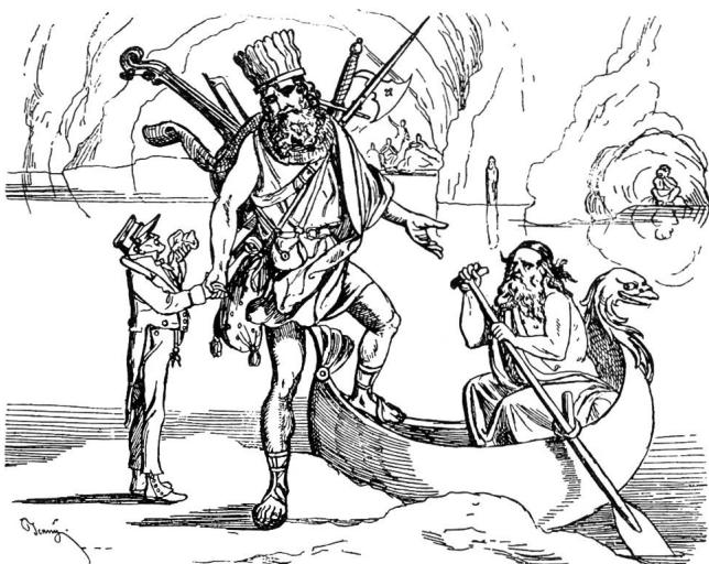
Abb. 49. Postheiri 31. 12. 1864: «Christophel, bevor er die Fahrt nach der Unterwelt beginnt, nimmt Abschied von seinem trauernden Freunde Hilarius Immergrün. Holzstich

«Postheiri» nach 15jähriger Korrespondententätigkeit in «Mutzopolis» definitiv verabschieden (Abb. 49). Ausgerüstet mit Schwert, Hellebarde und Baßgeige besteigt er, am Strom des Vergessens angelangt, die Fähre des Charon, um sich in die Unterwelt führen zu lassen. Zuvor aber heißt es vom trauernden Freund Hilarius Abschied nehmen. Ihm gelten denn auch die letzten Ratschläge des Christoffel: Man dürfe den Menschen nicht trauen, da auf sie kein Verlaß sei! Hilarius aber glaubt zu wissen, daß Christoffel letztlich sein Unglück selbst verschuldet habe: «Du bisch eister i dim Thurn ghocket und hesch di isolirt vom Fortschritt.» 305