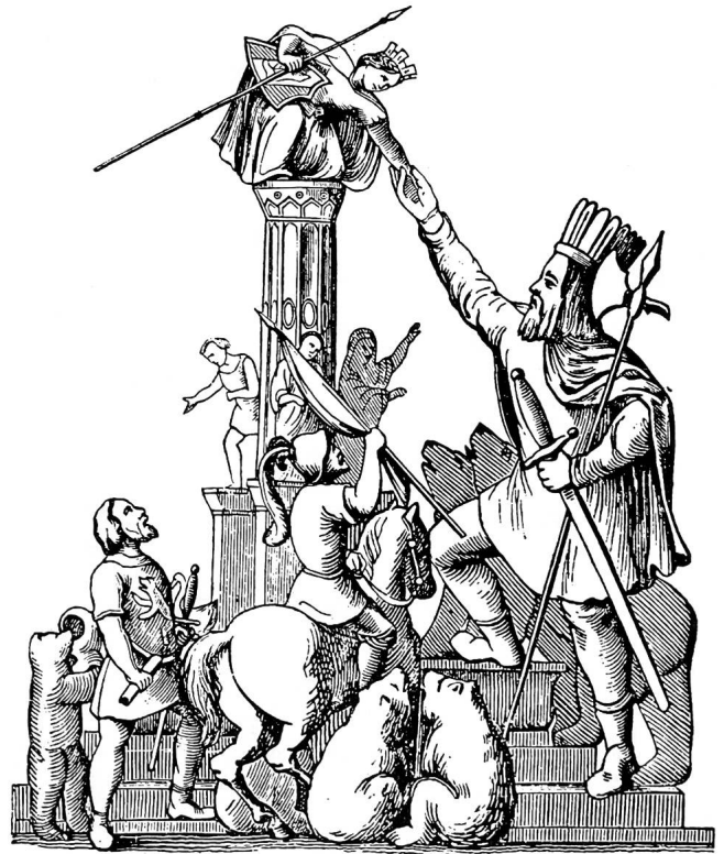
Abb. 46. Illustrierte Wochenzeitung 3. 10. 1863.: «Frau Berna empfängt die offizielle Visite des großen Christophels, des Erlachers und des Zähringers». Holzstich.