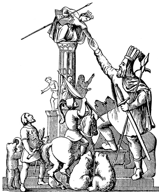
Abb. 46. Illustrierte Wochenzeitung 3. 10. 1863.: «Frau Berna empfängt die offizielle Visite des großen Christophels, des Erlachers und des Zähringers». Holzstich.