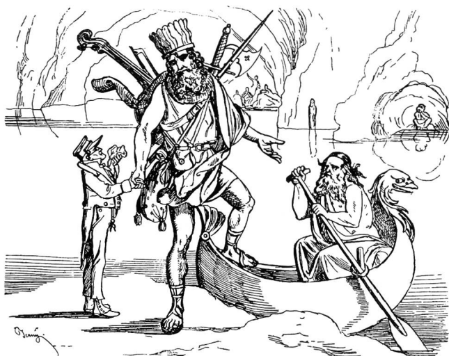
Abb. 49. Postheiri 31. 12. 1864: «Christophel, bevor er die Fahrt nach der Unterwelt beginnt, nimmt Abschied von seinem trauernden Freunde Hilarius Immergrün. Holzstich

«Postheiri» nach 15jähriger Korrespondententätigkeit in «Mutzopolis» definitiv verabschieden (Abb. 49). Ausgerüstet mit Schwert, Hellebarde und Baßgeige besteigt er, am Strom des Vergessens angelangt, die Fähre des Charon, um sich in die Unterwelt führen zu lassen. Zuvor aber heißt es vom trauernden Freund Hilarius Abschied nehmen. Ihm gelten denn auch die letzten Ratschläge des Christoffel: Man dürfe den Menschen nicht trauen, da auf sie kein Verlaß sei! Hilarius aber glaubt zu wissen, daß Christoffel letztlich sein Unglück selbst verschuldet habe: «Du bisch eister i dim Thurn ghocket und hesch di isolirt vom Fortschritt.» 305