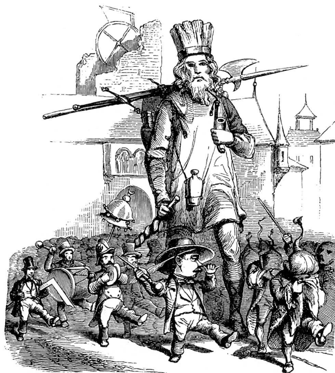
Abb. 45. Illustrierte Wochenzeitung 18. 4. 1863.: «Christoffels Abschied von Bern» am 7. 4. 1863. Holzstich.