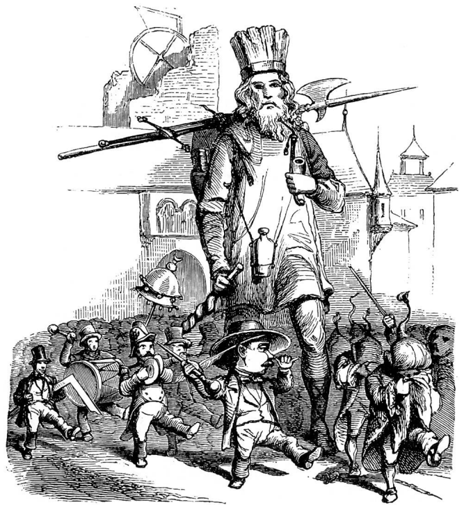
Abb. 45. Illustrierte Wochenzeitung 18. 4. 1863.: «Christoffels Abschied von Bern» am 7. 4. 1863. Holzstich.