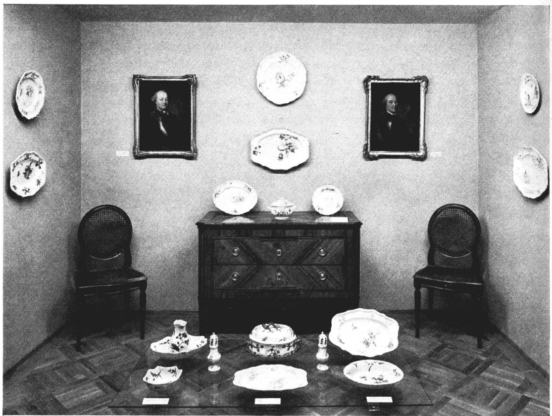
Abb. 2. Vitrine mit Berner und Lenzburger Fayencen

Sinne erfolgte Zusammenstellung der verschiedenartigsten Gegenstände wie Porträts, Waffen, Uniformen, Silbergeschenke, Orden und Urkunden, die mit dem Offizierskorps des 4. bernischen Regiments in neapolitanischen Diensten in Beziehung stehen. Die in Nola stationierten und unter dem Kommando von Oberst Friedrich Albrecht von Wyttenbach stehenden Offiziere des 4. Regiments legten im ersten Viertel des letzten Jahrhunderts eine Sammlung von griechischen und unteritalischen Vasen an, die sie dann 1830 der bernischen Bibliothekskommission als Geschenk überreichten. Diese in Nola gesammelten Gefäße, allgemein nur «Sammlung Nola» genannt, wurden in dem angrenzenden Raum in neuangefertigten Vitrinen ausgestellt und mit späteren Erwerbungen antiker Vasen sowie mit griechischen und römischen Münzen, Bronzen und Terrakotten sinnvoll zu einem Komplex von antikem Ausstellungsgut aus dem Mittelmeerraum ergänzt. Es konnte damit einem vielseitigen Wunsche von seiten der Wissenschaft und der Museumsfreunde entsprochen werden. Mit der Neugestaltung dieses «Mittelmeerkabinetts» in einem Raume, der früher dem Gutenbergmuseum zur Verfügung stand, gelangte nun auch die Neugestaltung des zweiten Stockwerkes zu ihrem endgültigen Abschluß (Abb. 4/5).