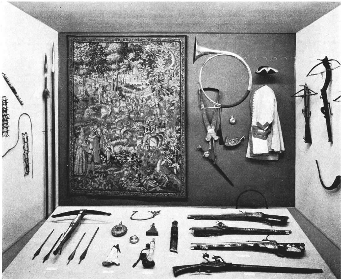
Abb. 3. Die Jagdvitrine im zweiten Stockwerk