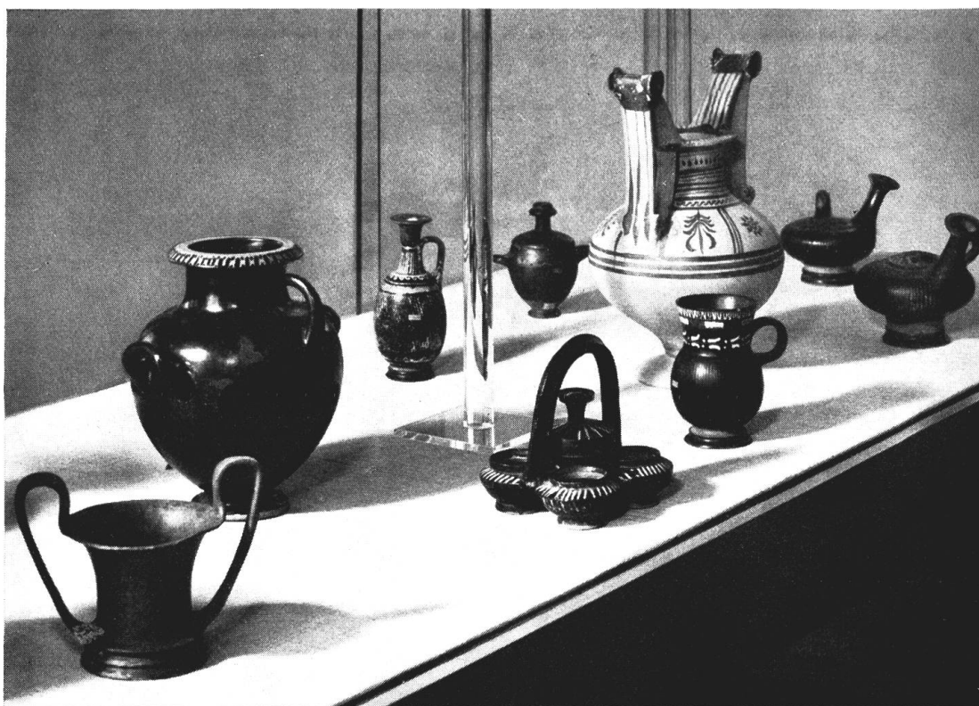
Abb. 4. Ausschnitt aus der neuengerichteten Antikensammlung

Burgdorf, Rittersaalverein : Gedächtnisausstellung Johann Grimm. — Lausanne, Exposition Nationale Suisse : Beteiligung an verschiedenen Sektoren. — Paris, Musée Guimet : Emblèmes, Totems, Blasons. — Thun, Historisches Museum : Die Zähringer Städte; Kunstsammlung der Stadt Thun / Schloß Schadau : Thuner Kunst früherer Zeiten. — Zürich, Schweiz. Landesmuseum / ZunftHaus zur Meise : Zürcher Porzellan.