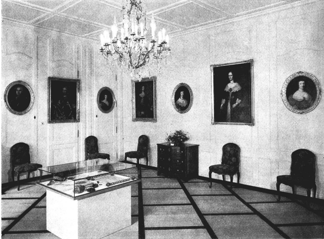
Abb. 6. Schloß Oberhofen. Raum mit Bildnissen der Familie von Erlach

einzigster brauchbarer Raum erwies sich der Keller unter der Kapelle, der neben dem mittelalterlichen Burgraum liegt. Das Zusammensetzen der zerlegten Eichenkonstruktion war verhältnismäßig einfach, heikel dagegen der Transport besonders der großen Glocke durch die engen Passagen. Dank der Umsicht unseres Schloßwarts Albert Schwery gelangten diese schweren Museumsstücke unversehrt an ihren neuen Bestimmungsort.