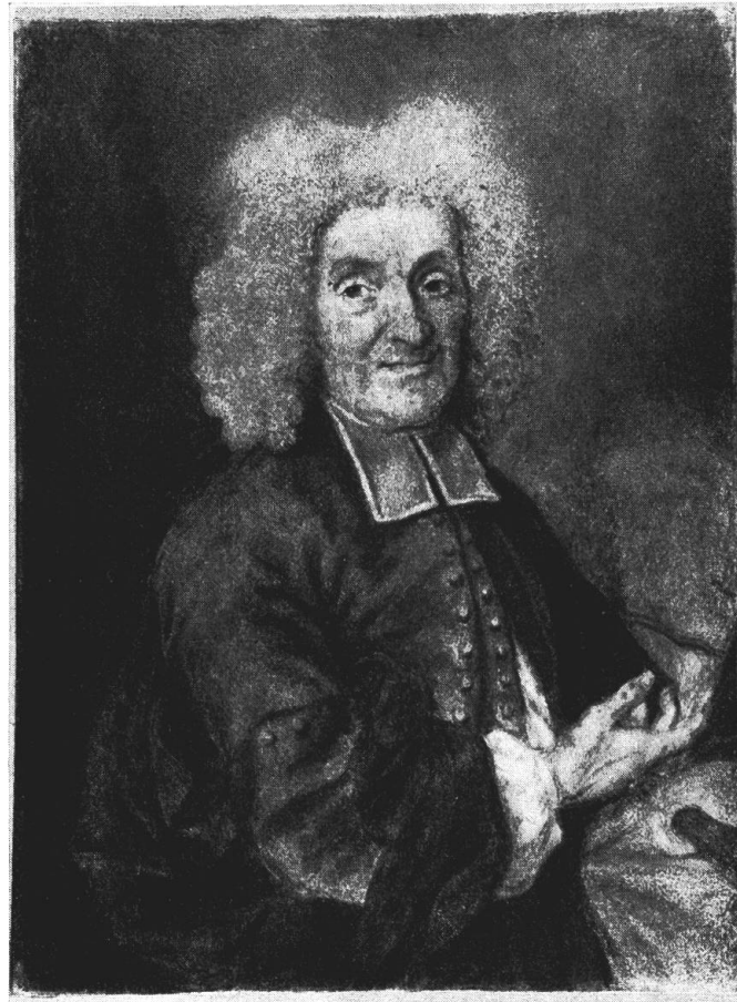
Abb. 9. Johann Grimm, Johann Dünz (1730). Kunstmuseum Bern

(Abb. 9) 35 . Es zeigt unverkennbar denselben Menschen mit denselben Gesichtszügen wie das Dünzsche Selbstbildnis. Der Vergleich des Porträts mit demjenigen von Dünz beweist, daß beide Maler um größtmögliche Objektivität bemüht waren. Wie weit der veränderte Ausdruck, das leicht fragende Staunen und die Resignation, welche das Altersbildnis kennzeichnen, dem hohen Alter und somit der anderen