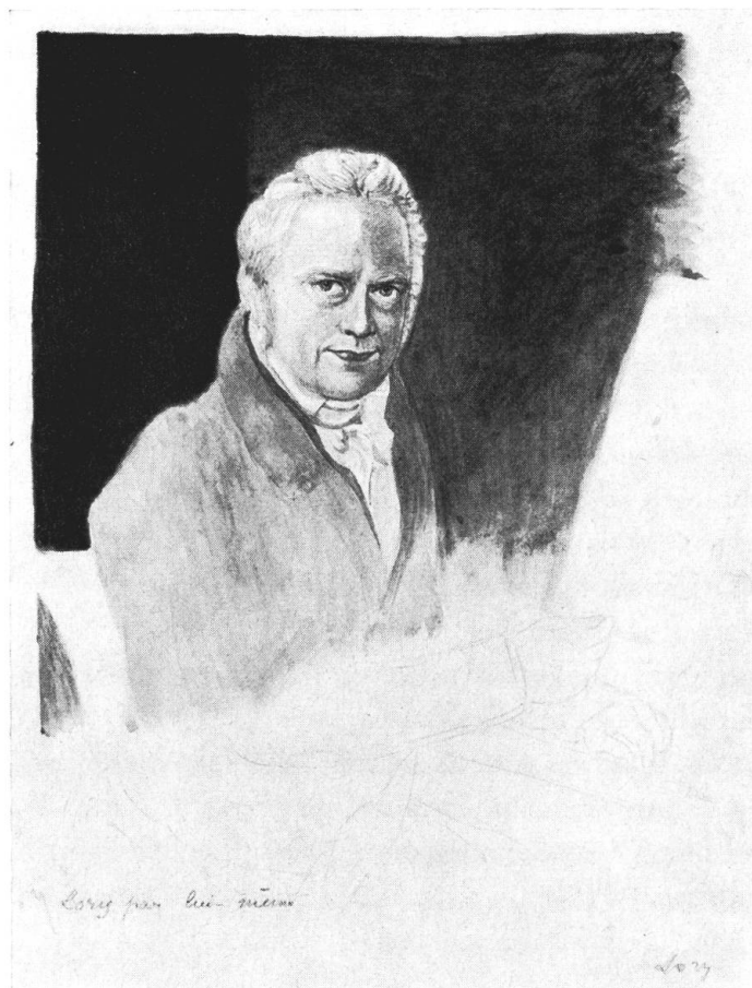
Abb. 2. Gabriel Ludwig Lory (?), Selbstbildnis (um 1825–1830). Kunstmuseum Bern

finden ließen 12 . Die nur mit «S» signierten Berner Bildnisse zeigen manchmal eine leichte Tendenz zur Räumlichkeit, im Lory-Porträt sogar zur in sich gedrehten Figur, wie sie bei Sulzer neben kompositionell starreren Werken zu finden ist. Sulzer liebt es bisweilen, die Figur in den Bild-Vordergrund zu stellen und die