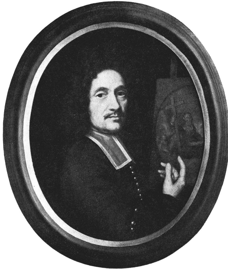
Abb. 7. Johann Dünz, Selbstbildnis (1695). BHM

welche sich durch eine großzügigere, lockere Malweise und Formgebung sowie durch aufwendige Farben und Kostüme auszeichnen, noch der niederländischen Bildnistradition verpflichtet ist, gelangt er in seiner mittleren Zeit zu einem eigenen sachlichen und präzisen Bildnisstil und zu einer zart lasierenden, kompakten Malweise. Die Bildnisse dieser Schaffensperiode weisen trotz ihrer Kleinteiligkeit eine