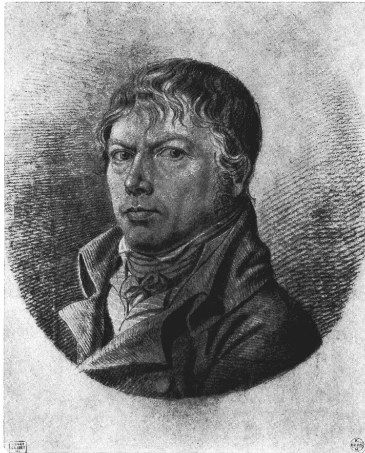
Abb. 3. Mathias Gabriel Lory(?), Gabriel Ludwig Lory (um 1805). Kunstmuseum Bern

Abb. 4) 17 . Sie zeigen zweifellos denselben Menschen mit den etwas gespannten, harten, trotzig Zügen und dem nach romantischer Mode stark in die Stirn gekämmten Haar in zwei verschiedenen Altersstufen. Sie sind möglicherweise um 1805 und um 1815 entstanden und zeigen also den Künstler in den frühen Vierziger- und den frühen Fünfzigerjahren. Sie entsprechen ganz dem in der Überlieferung