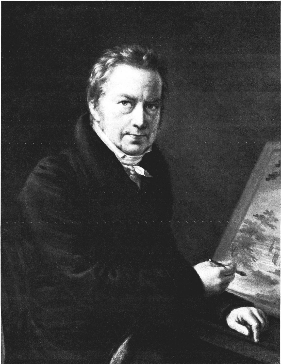
Abb. 1. David Sulzer, Gabriel Ludwig Lory (um 1825/1830). BHM