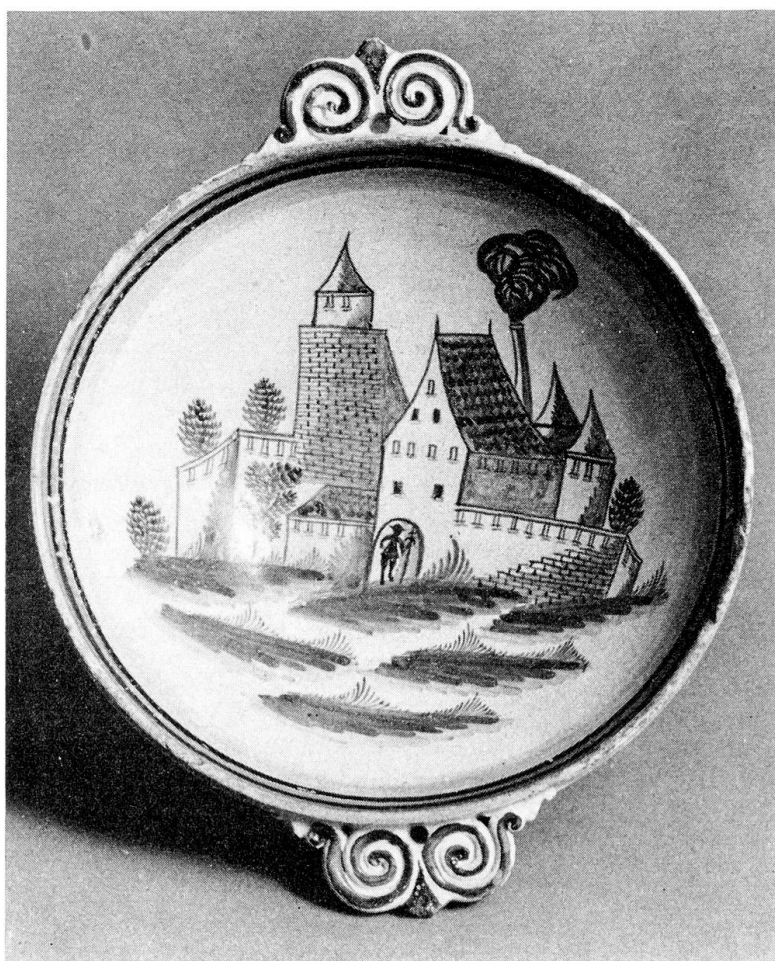
Abb. 4. Simmentaler Fayence-Schüssel, Mitte 18. Jahrh.