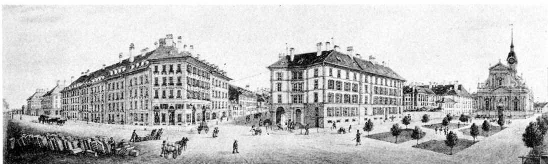
Abb. 3. Friedrich Zimmer (1808–1846) zugeschrieben, Das Bollwerk in Bern um 1840