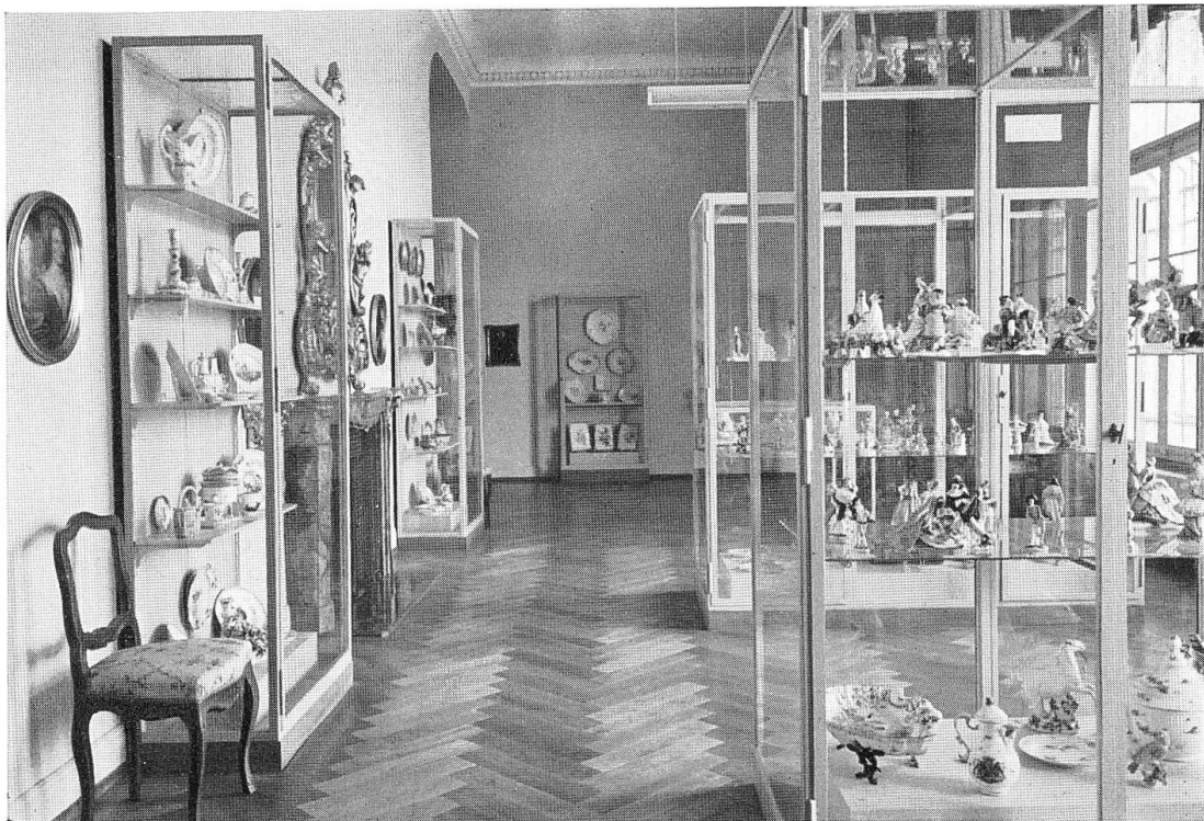
Tafel 18. Neuaufstellung der Sammlungen. Oben: Berner Standessaal, 17. und 18. Jahrh. — Unten: Städtische Fayence und Porzellan (Slg. Kocher), 18. Jahrh. Text S. 185.