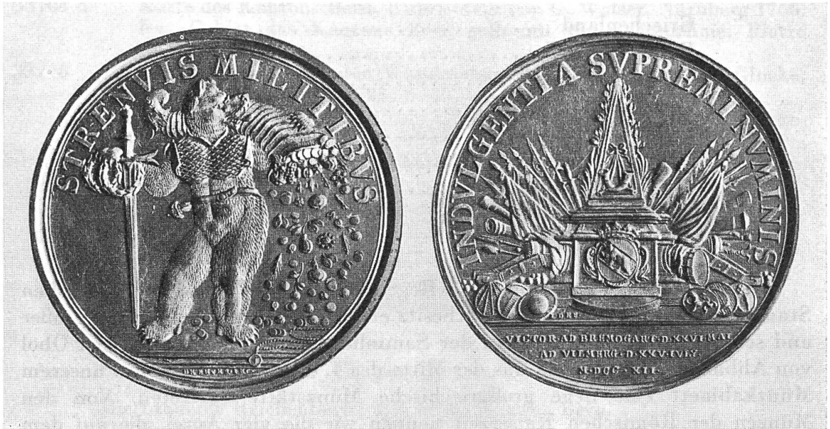
Abb. 47. Neuerwerbung: J. de Beyer 1712, Bernische Verdienstmedaille zur Erinnerung an die Siege von Bremgarten und Villmergen. Gold. Text S. 159.

den tapferen Kämpfern, steht beigeschrieben. Auf der Rückseite ist eine große Pyramide mit Berner Wappen, Banner- und Waffentrophäen dargestellt. Wie wichtig der Künstler selbst seine Arbeit genommen hat, mag daraus hervorgehen, daß er zweimal signierte, auf dem Avers DE BEYER. FEC., rückseitig mit den Initialen I. D. B. F. Ob unser Exemplar jemals einem Offizier verliehen worden ist, bleibt unbekannt; es stammt aus altem Berner Besitz (Abb. 47).