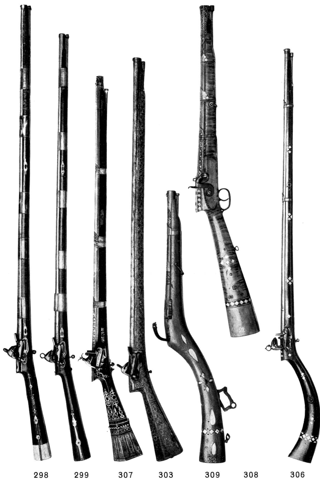
Taf. LXIII. Persische Gewehre.