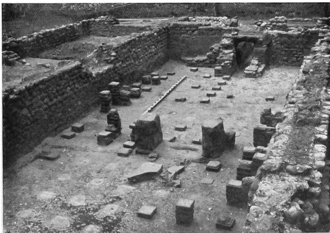
Römische Badeanlage auf der Engehalbinsel bei Bern. Blick ins Lau- und Heissbad.

Das länglich rechteckige Haus misst 20 m Länge Richtung O=W und 16 m Tiefe Richtung N=S. Von der römischen Siedlungsstrasse