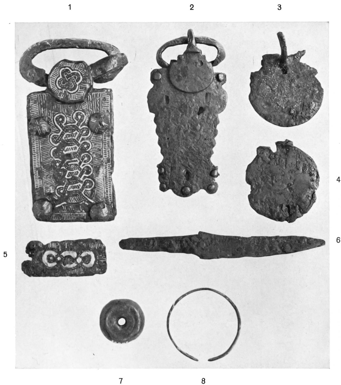
Taf. 1. Oberwangen.

Abb. 1—5 = Gürtelschnallen; 6 = Bronzemesser; 7 = Spinnwirtel; 8 = Bronze- armring, verziert.