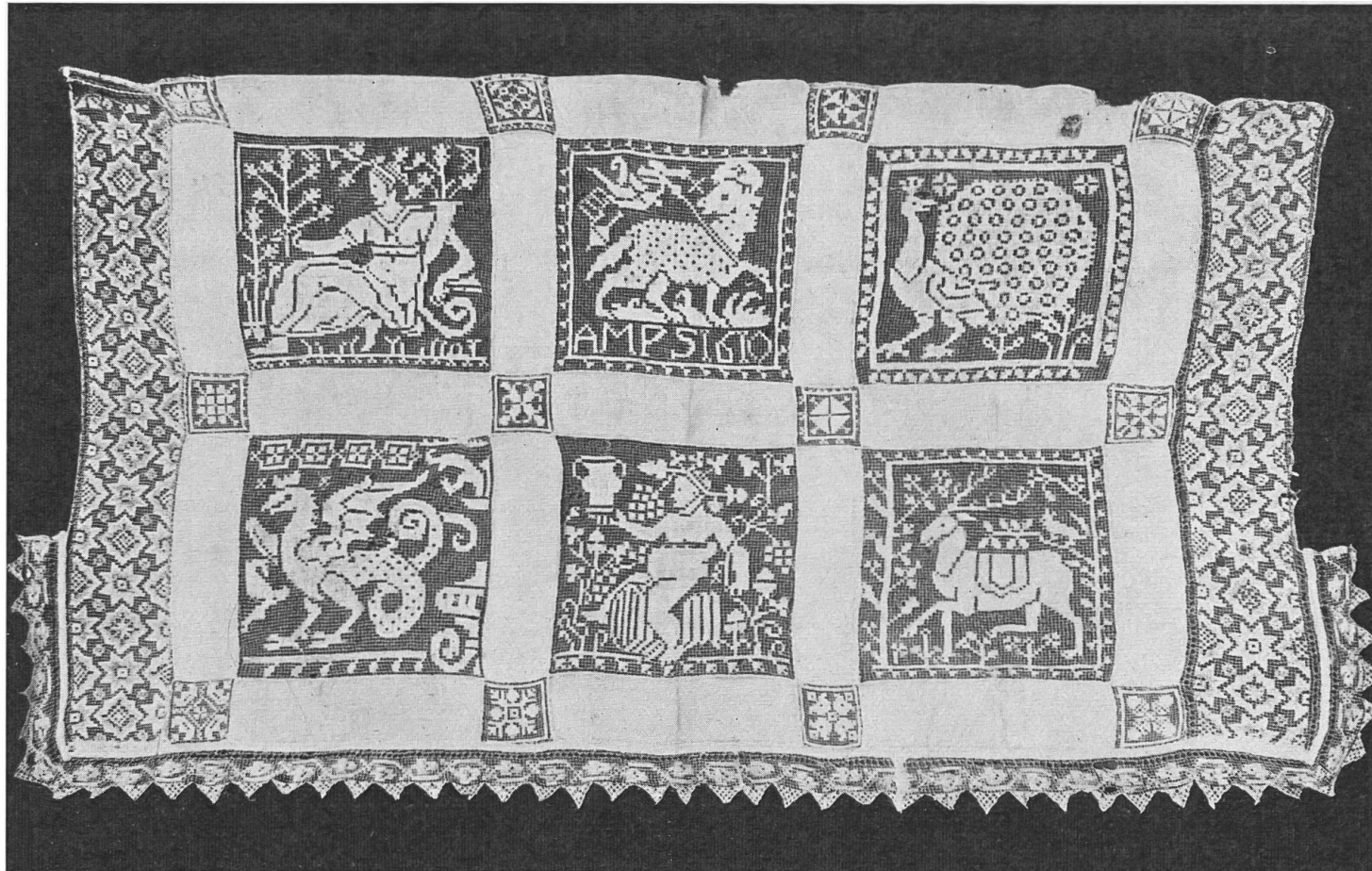
Leinenstickerei, bezeichnet AMPS 1610. Filetstickerei.