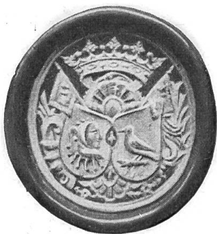
Siegelstempel der Gesellschaft zu Narren und Distelzwang. 17. Jahrh.

Das Jahr 1936 stand im Zeichen der Krise und der Zurückhaltung bei Ankäufen. Bei der Kürzung unserer Subventionen ist es ein Glück, dass uns der Museumsverein zur Seite steht, und dass uns unsere Freunde und Gönner nicht im Stiche lassen. Wir dürfen auch im Berichtsjahre viele und zum Teil bedeutende Geschenke und Depositen aufzählen.