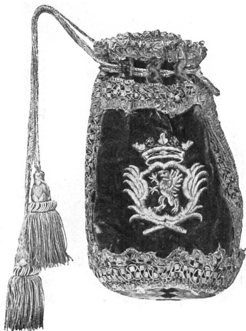
Siegelbeutel des Äussern Standes mit Wappen Tschanner. 18. Jahrh.

eingelegtem Rande. Im Vordergrund steht der Weibel in Amtstracht mit Stab. Die Namen der Dargestellten stehen auf im Halbkreis angeordneten Schriftbändern, unten auf einem schrankenartigen Bande. Sie weisen, soweit es die Gerichtssässen betrifft, nach Rohrbach. Herr a. Staatsarchivar Kurz, dem wir diese Feststellung verdanken, hält die Scheibe für eine Vogtgerichtsscheibe von Rohrbach. Auf dem Tisch Tintenzeug und vier Pergamentbriefe mit Aufschriften 100, 2000, 300, 200, sowie ein grosser und ein kleiner Geldhaufen. Vor dem Landvogt liegt das Szepter. Von den Dargestellten nennen wir die beiden Hauptpersonen, Beatus Fischer 1) , Landvogt zu Wangen und Herr zu Reichenbach und den Landschreiber Hans Jakob Wild 2) . Die Köpfe des Landvogts und des Landschreibers verraten sichtlich erstrebte Porträtähnlichkeit (Schnurrbärte), alle übrigen zeigen die gleiche schematische Barttracht. Die Scheibe ist nicht datiert. Da Beat Fischer 1680–1686 Landvogt zu Wangen war und 1683 die Herrschaft Reichenbach kaufte, muss ihre Herstellung in die Jahre 1683–1686 fallen. Leider ist sie ein Fragment; auch das Oberbild mit einer Wirtshausszene ist nicht zugehörig. An die Erwerbung aus England haben die HH. a. Burgerratspräsident K. D. F. v. Fischer und Architekt H. B. v. Fischer Beiträge gegeben.