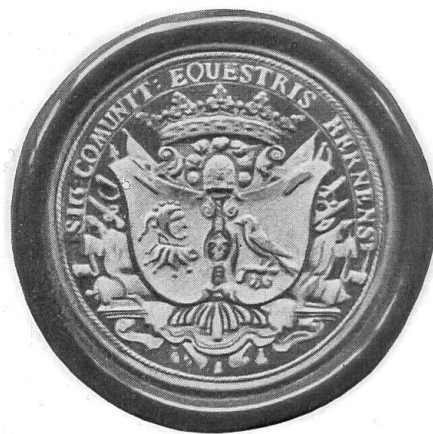
Siegelstempel der Gesellschaft zu Narren und Distelzwang. 18. Jahrh.

Die neuerworbenen Glasgemälde haben weniger künstlerischen als kulturgeschichtlichen Wert. Eine Gerichtsscheibe aus dem Ende des 17. Jahrhunderts haben wir nicht so sehr der Darstellung wegen — es ist eine Gerichtsszene, wie sie aus dieser Zeit mehrfach erhalten geblieben ist — als der dargestellten Persönlichkeiten wegen erworben. Immerhin verdient auch die Darstellung selbst unser Interesse. In einem Zimmer mit gewölbter Decke und fünf Fenstern mit Butzenverglasung sitzt das dreizehnköpfige Gericht an einem rechteckigen Schiefertisch mit