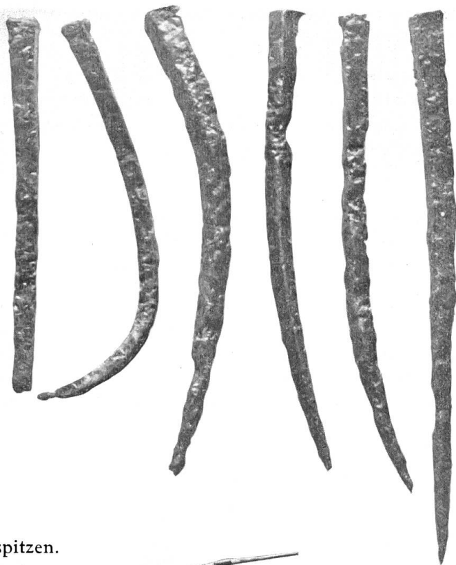
Keltenwall. Eisenspitzen. 1/3 nat. Grösse.

Da in den nächsten Jahren an dieser Stelle weitere Grabungen vorgesehen und von der bürgerlichen Forstverwaltung in verdankenswerter Weise zugesichert sind, können wir uns mit diesem vorläufigen Fundbericht begnügen.